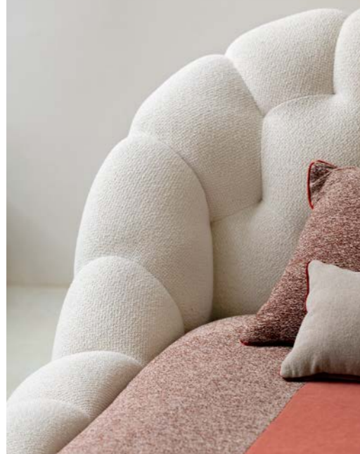
Bubble - design Sacha Lakic Cama totalmente capitonné