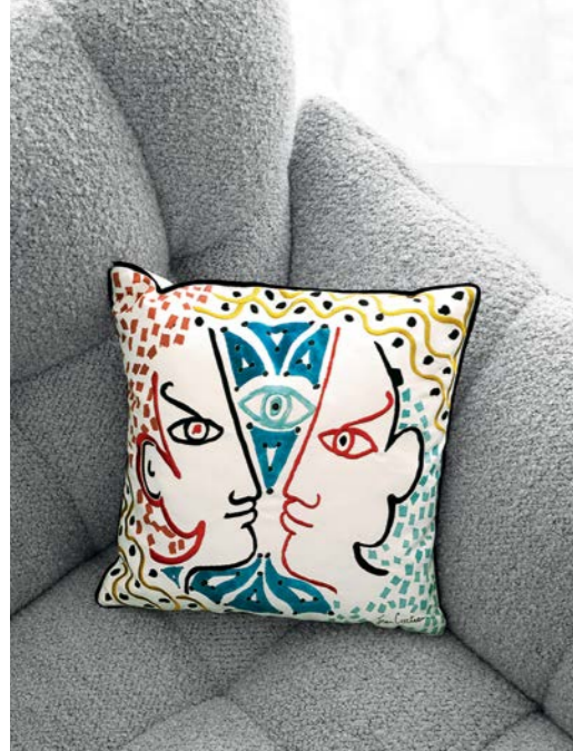
Coleção de almofadas Jean Cocteau.