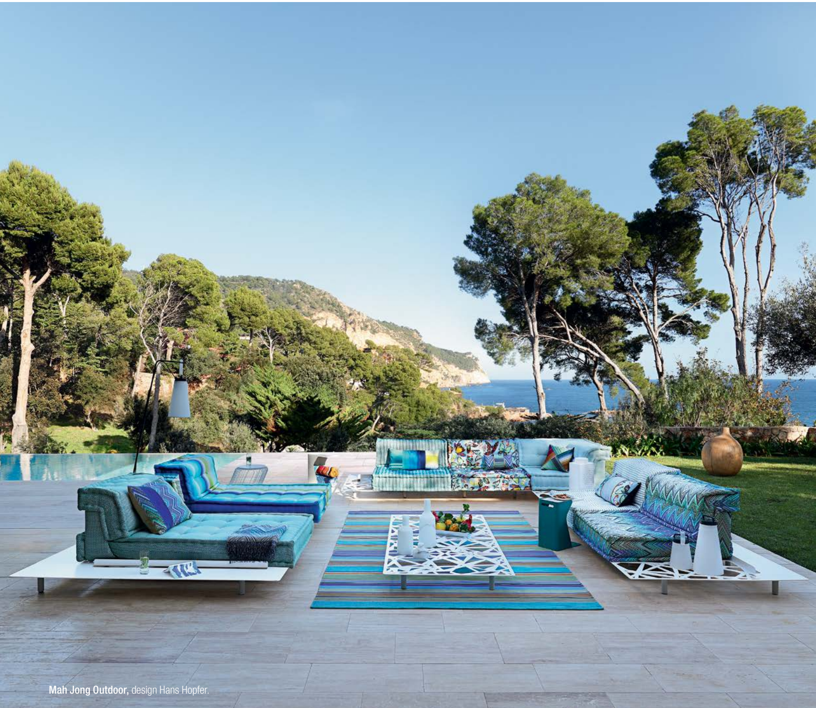
Mah Jong Outdoor, design Hans Hopfer.

AS TENTAÇÕES 10-27 ABRIL PREÇOS MUITO SEDUTORES SOBRE A NOVA COLEÇÃO