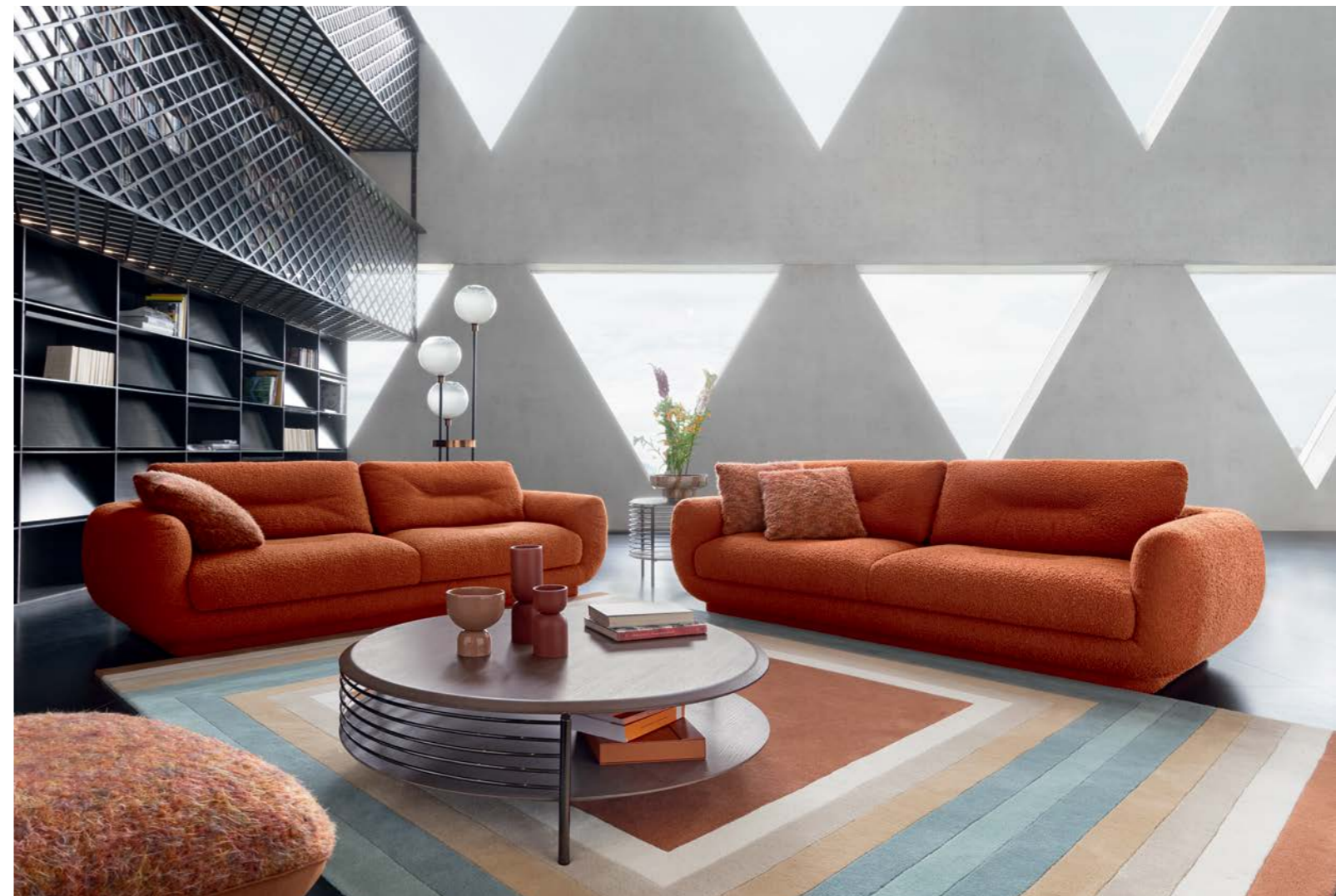
Intemporel - design Maurizio Manzoni Sofá 3-4 lugares, encostos rebatíveis