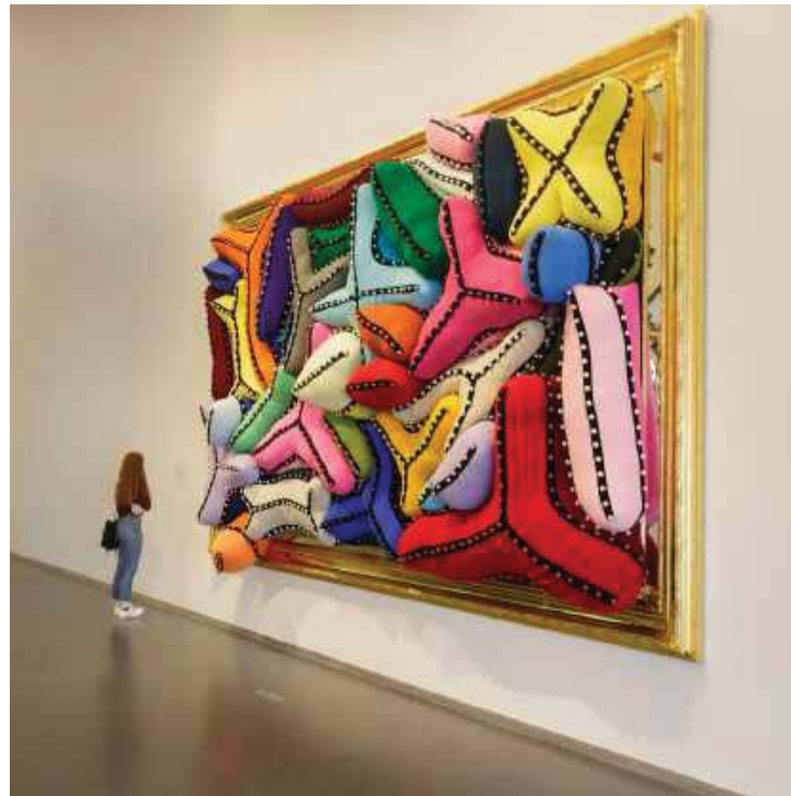
Finisterra (2018) by Joana Vasconcelos

È stata la prima donna e la più giovane artista ad esporre alla Reggia di Versailles, nel 2012. Tra gli eventi che hanno segnato la sua carriera ci sono: la mostra al Museo Guggenheim Bilbao; Trafaria Praia , progetto per il padiglione del Portogallo alla 55esima Biennale di Venezia (2013); la partecipazione all'esposizione collettiva The World Belongs To You a Palazzo Grassi/Fondazione François Pinault, a Venezia (2011); e la sua prima retrospettiva che ha avuto luogo al Museo Coleção Berardo, a Lisbona (2010).