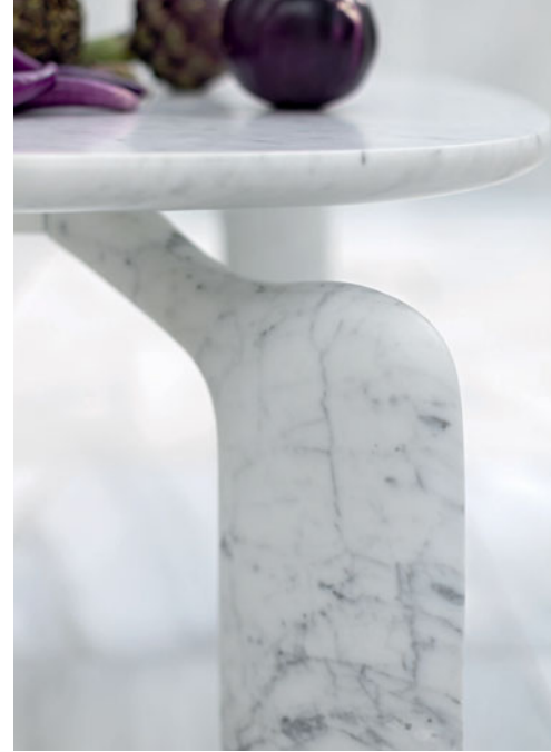
Pulp - diseño Eugeni Quitllet Mesa de comedor en mármol de Carrara