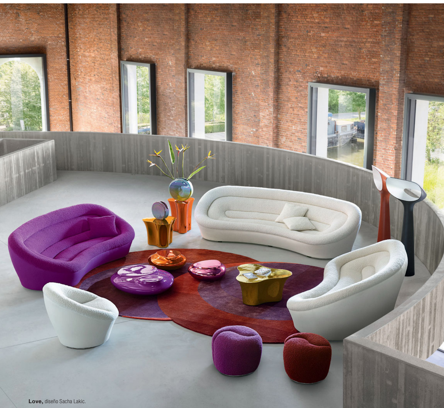
Love, diseño Sacha Lakic.

||| LOS DÍAS 8-25 NOVIEMBRE EXCEPCIONALES