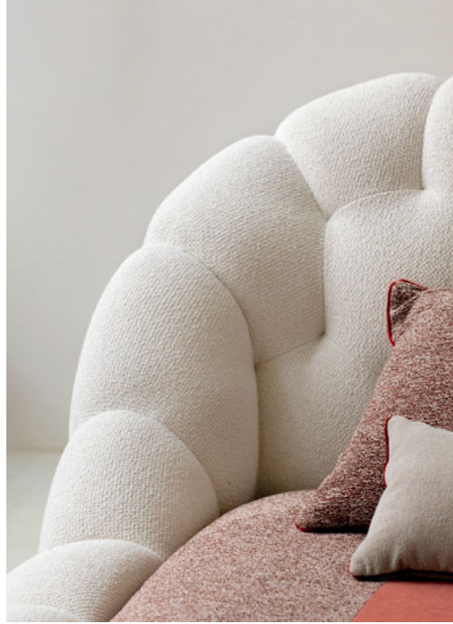
Bubble - diseño Sacha Lakic Cama totalmente capitoné $43,500,000* en vez de $51,150,000