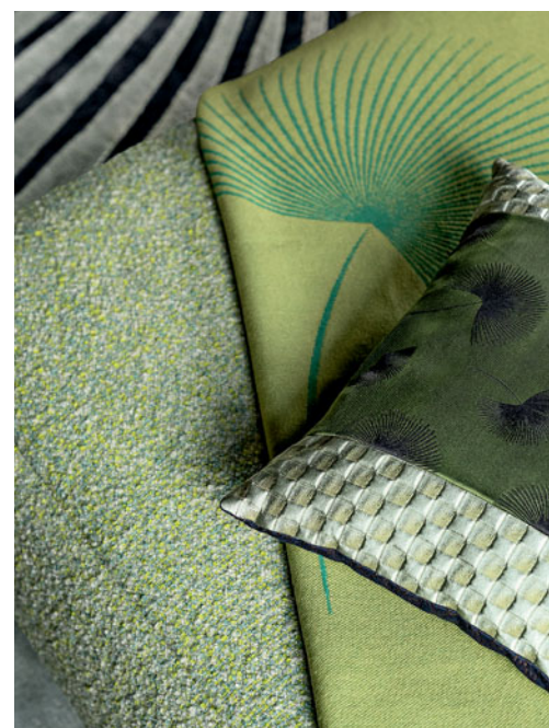
Lagune - diseño Philippe Bouix Sofá modular, respaldos elevables