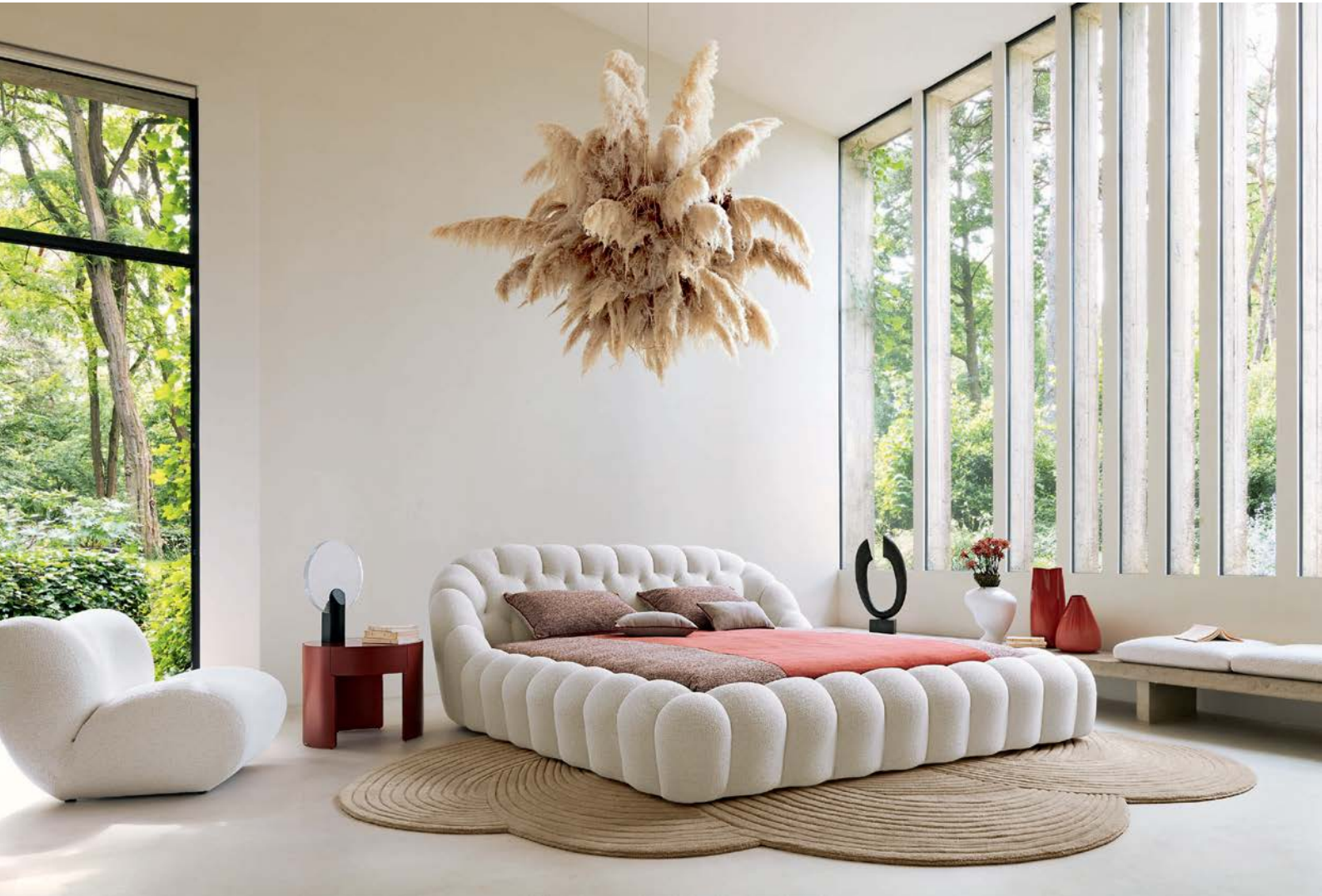
Bubble - designer Sacha Lakic Letto, interamente trapuntato