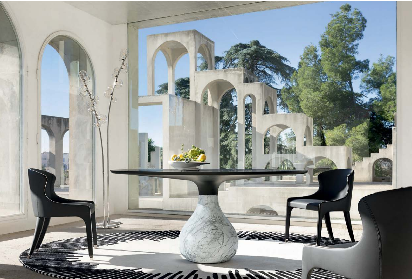
Aqua - designer Fabrice Berrux Tavolo da pranzo tondo, base in marmo di Carrara CHF 7 390* invece di CHF 8 410