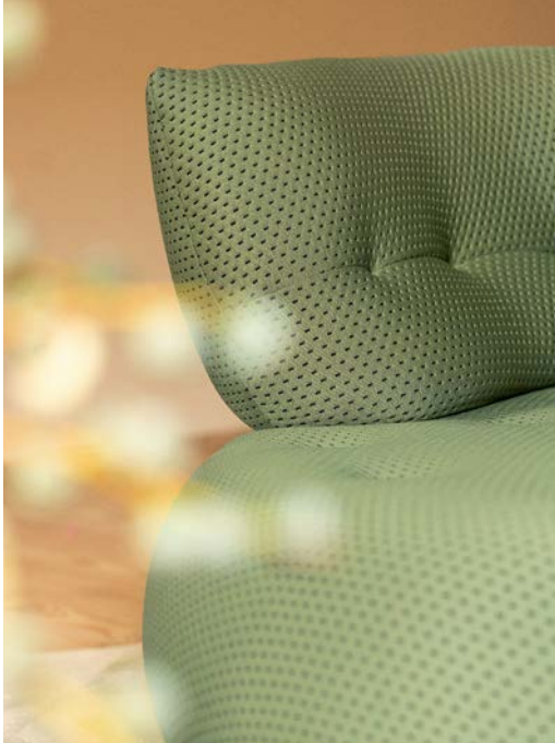
Sense - designer Studio Roche Bobois Divano componibile CHF 4 750* invece di CHF 5 490