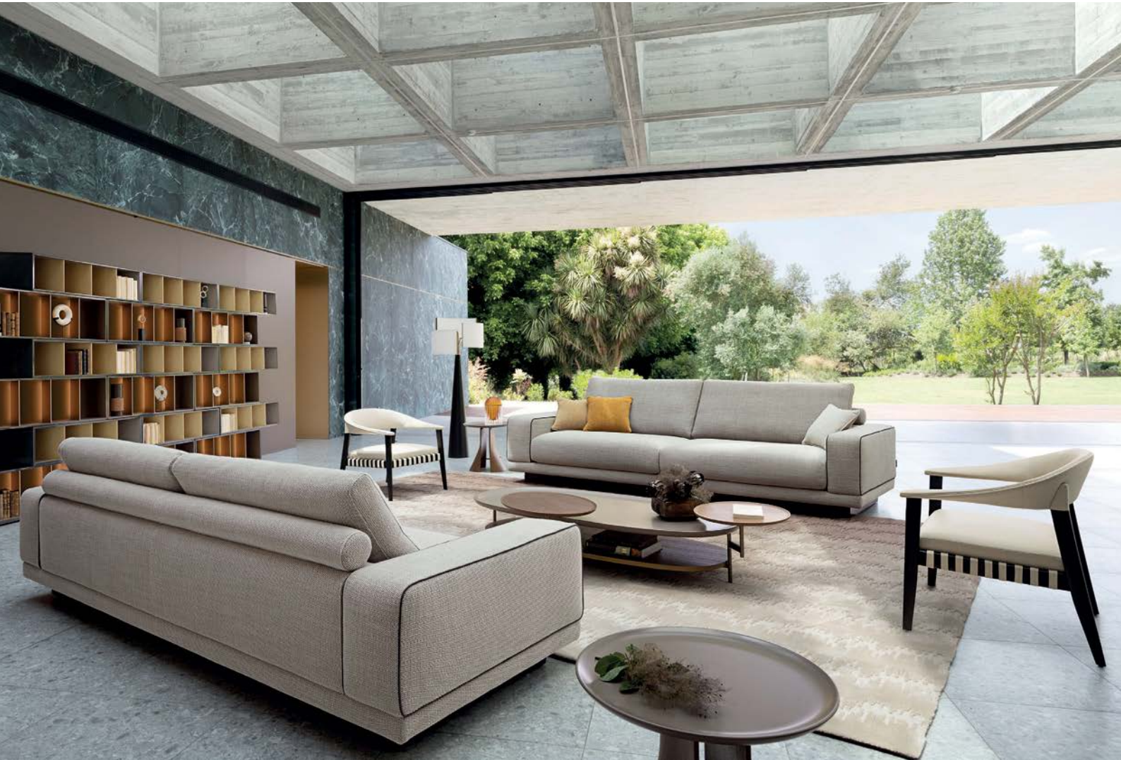
Altéa - designer Philippe Bouix Divano 3 posti maxi