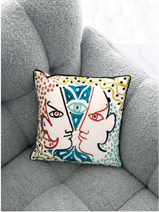
Collezione di cuscini Jean Cocteau.

Setup - designer Sacha Lakic Divano 3 posti maxi interamente trapuntato