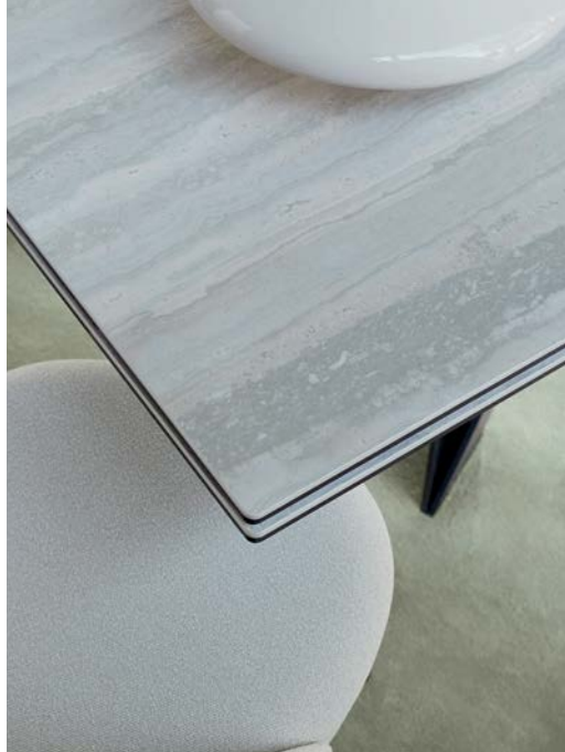
Cigale - designer Andrea Casati Tavolo da pranzo con prolunghe integrate, piano in vetro e ceramica