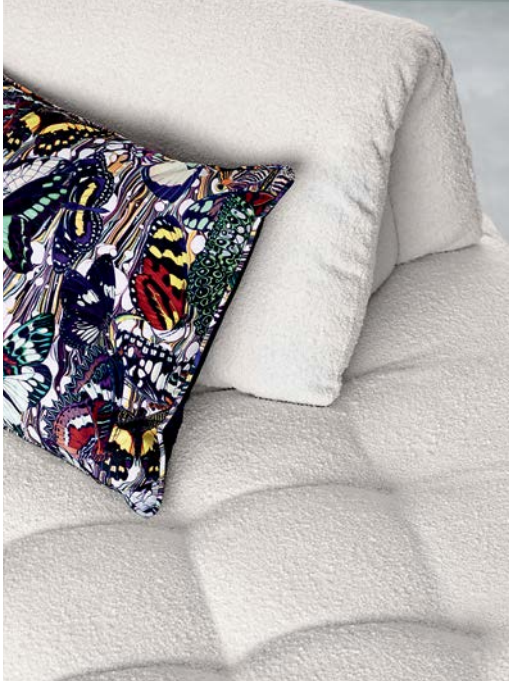
Conversation - designer Philippe Bouix Banquette 3 posti maxi