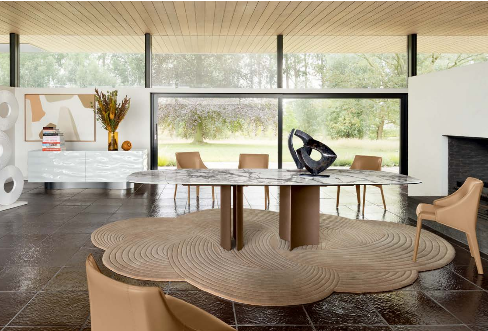
Deltalis - designer Maurizio Manzoni Tavolo da pranzo con prolunghe integrate, piano in vetro e ceramica CHF 5 490* invece di CHF 6 550