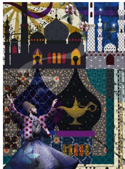
ISTANBUL, TAPIS. ISTANBUL, RUG.