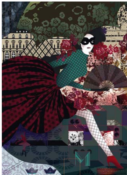
PARIS, TAPIS. PARIS, RUG.

Marcel Wanders a dessiné pour Roche Bobois la collection Globe trotter. Cette collection, singulière et éclectique, s'inspire des aventuriers et explorateurs de légende, collectionneurs d'objets rares, passionnés des cultures découvertes au fil de leurs expéditions. On y retrouve l'ouverture d'esprit, la liberté et l'inspiration qui marquent le travail de son créateur. Une grande fresque illustrée, magnifique promenade aux pays des merveilles peuplée de tous les personnages des romans de notre enfance, articule l'ensemble de la collection. Elle est le fil conducteur qui relie les différentes pièces, les différents univers. Mêlant habilement références historiques et voyages imaginaires, Marcel Wanders nous offre avec Globe trotter une « collection promenade » à la fois romanesque et poétique.