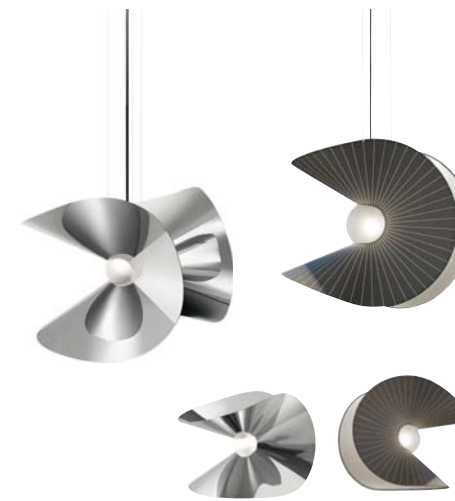
Table lamp: L. 55 x D. 48 x H. 40 cm.

Suspension GM: L. 70 x D. 55 x H. 55 cm. (fabric version only).