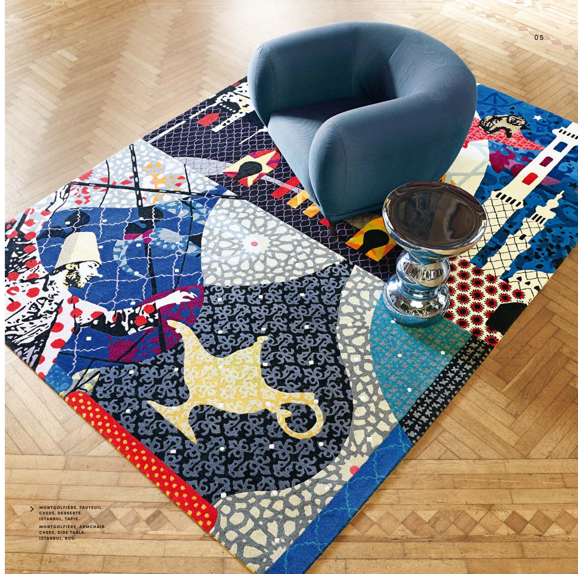
MONTGOLFIERE, FAUTEUIL. CHESS, DESSERT. ISTANBUL, TAPIS. MONTGOLFIERE, ARMCHAIR. CHESS, SIDE TABLE. ISTANBUL, RUG.