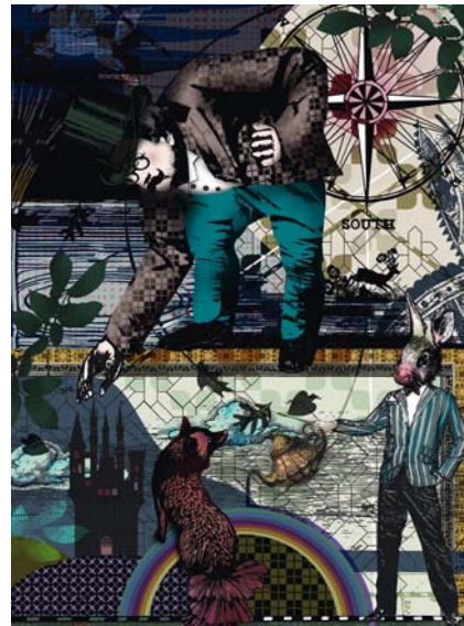
LONDON, TAPIS. LONDON, RUG.

Marcel Wanders designed the Globe trotter collection for Roche Bobois. This unique and eclectic collection is inspired by the legendary adventurers and explorers who traveled the world to discover new cultures and rare objects. The collection expresses openness, freedom and inspiration, showcasing Marcel Wanders' signature design style. A large illustrated fresco portrays a whimsical wonderland, inviting one to take a walk among all the familiar characters from our beloved childhood stories. The fresco connects the pieces and different worlds to create a cohesive story throughout the entire collection. Cleverly combining historical references and imaginary journeys, Marcel Wanders' Globe trotter is a romantic and poetic "promenade collection".