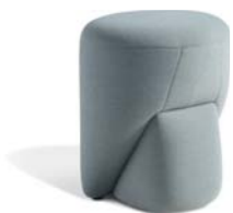
▲ PARROT (pages 12, 13)