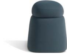
▲ GIZMO (pages 12, 13)