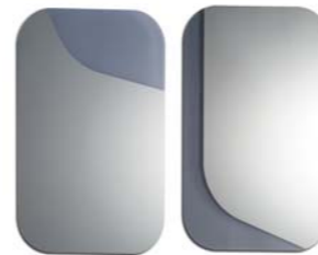
▲ SWOOSH (page 20)

Set de 2 miroirs en verre fumé avec argenture sélective.