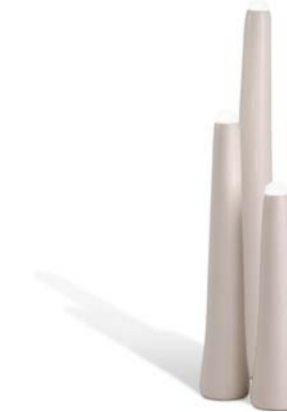
▲ STALAGMITES (pages 11, 15, 21, 22, 23)

Série de 3 lampes à poser en céramique. Finition blanc brillant ou givré craquelé. Source lumineuse LED intégrée.