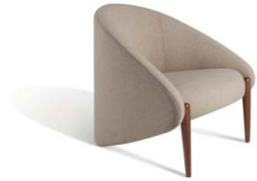
▲ WALRUS (pages 8, 9, 14, 15, 16)

Fauteuil habillé de tissu. Assise mousse HR bi-densité 30-35 kg/m 3 . Dossier mousse HR tri-densité 30-35-75 kg/m 3 . Structure sapin massif et multiplis de pin. Suspension sangles élastiques XL entrecroisées. Piétement Noyer massif finition Naturel vernis.