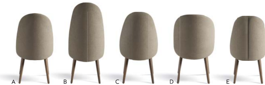
▲ IDENTITIES (pages 4, 5, 6, 7)

Series of 3 ceramic table lamps. Bright white or frosted finish. Integrated LED light source.