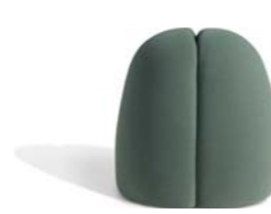
▲ GRAIN (pages 12, 13)