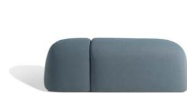
▲ HIPPO (pages 12, 13)