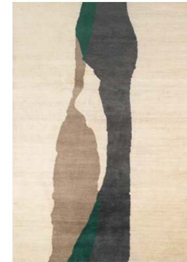
▲ MERGE DAWN & FUSION MIDNIGHT (pages 4, 7, 8, 9, 12, 13, 14, 15)

Tapis noués main en laine naturelle mélangée. Jeu d'ombres et de traces superposées.