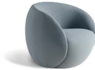
▲ DOT (page 19)

Fauteuil habillé de tissu. Coussin d'assise mousse HR bi-densité 25-35 kg/m 3 . Dossier mousse HR bi-densité 20-35 kg/m 3 . Structure sapin massif et multiplis de pin. Suspension sangles élastiques XL. Piétement pivotant métal chromé, avec mécanisme de retour automatique à mémoire de position.