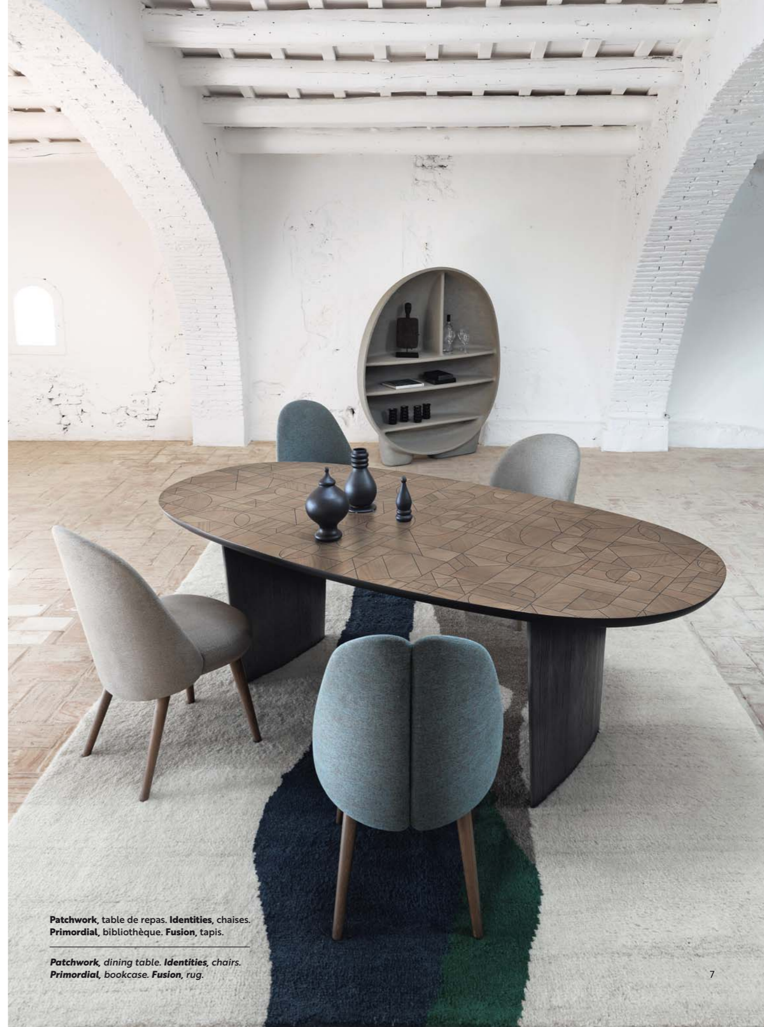
Patchwork , table de repas. Identities , chaises. Primordial , bibliothèque. Fusion , tapis.