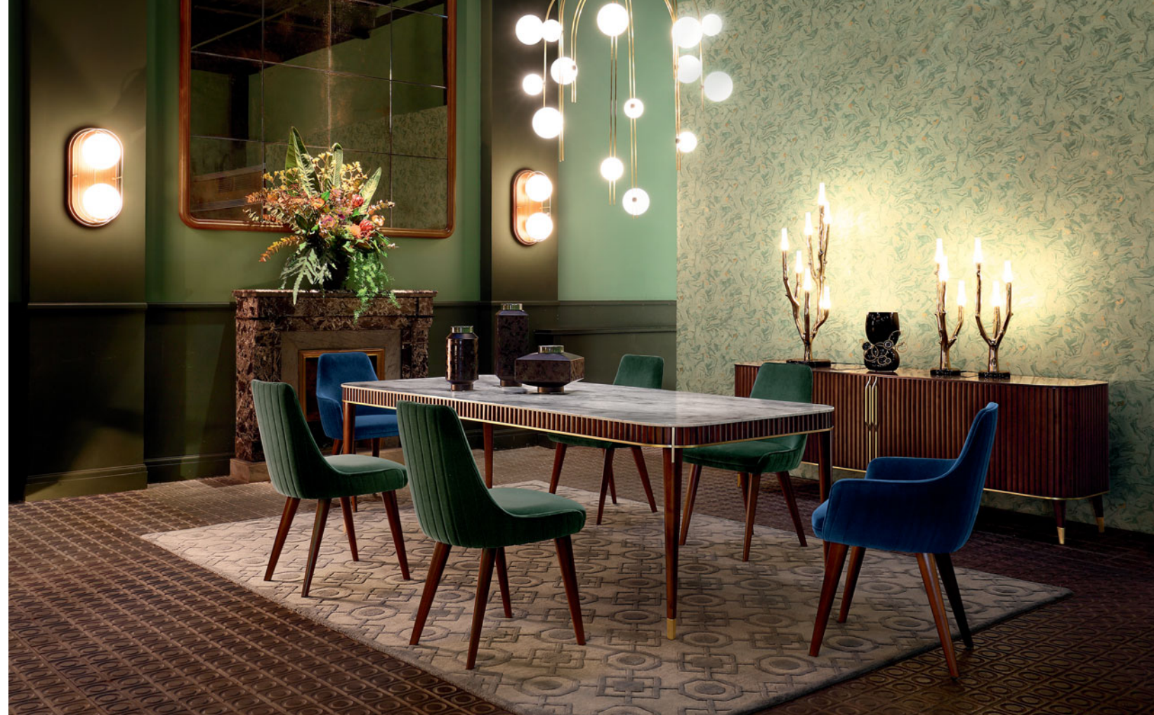
Edén Rock - design Sacha Lakic

Mesa de jantar, tampo em mármore de Carrara