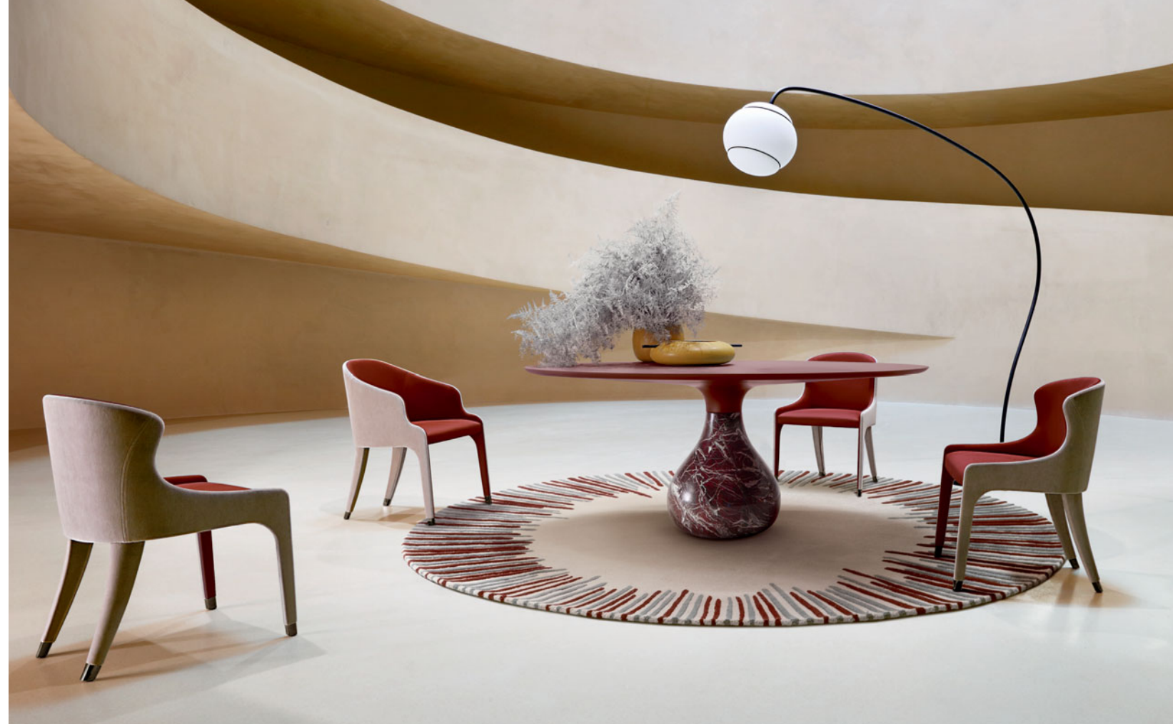
Aqua - design Fabrice Berrux

Mesa de jantar, base em mármore, edição limitada a 200 peças