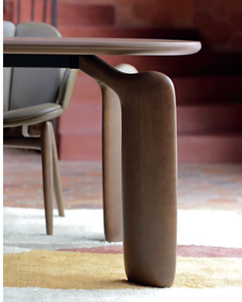
Pulp - design Eugeni Quitllet Mesa de jantar