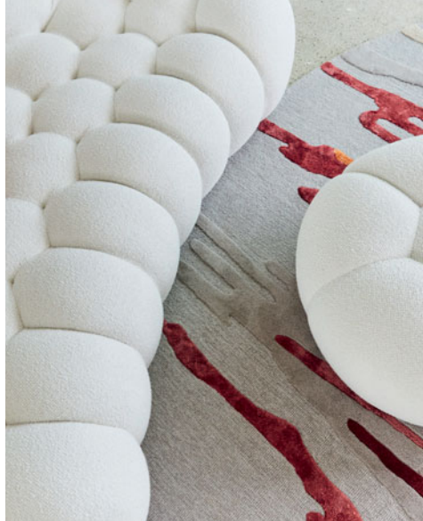
Bubble 2 - design Sacha Lakic Sofá 3-4 lugares arredondado