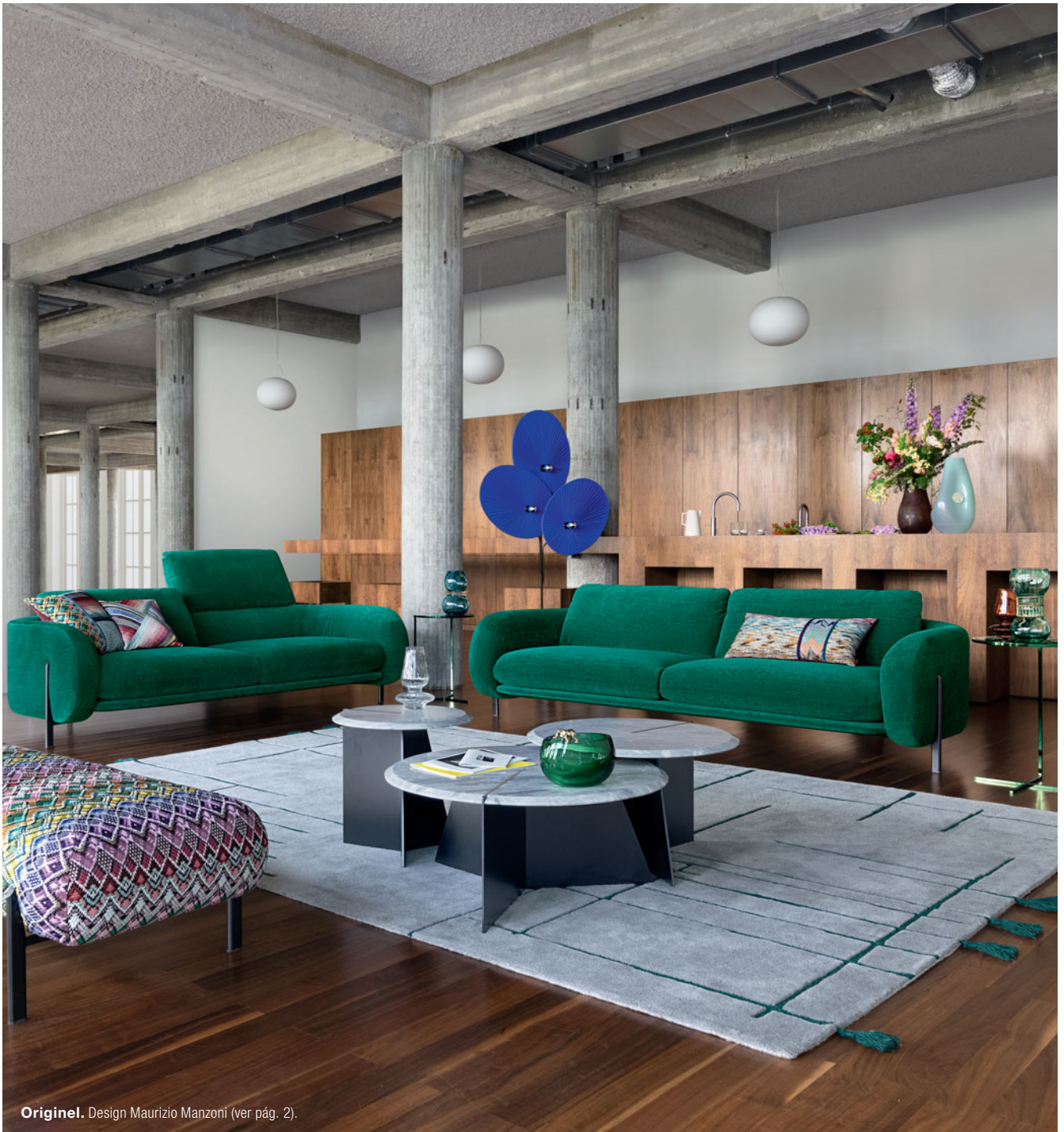
Original. Design Maurizio Manzoni (ver pág. 2).