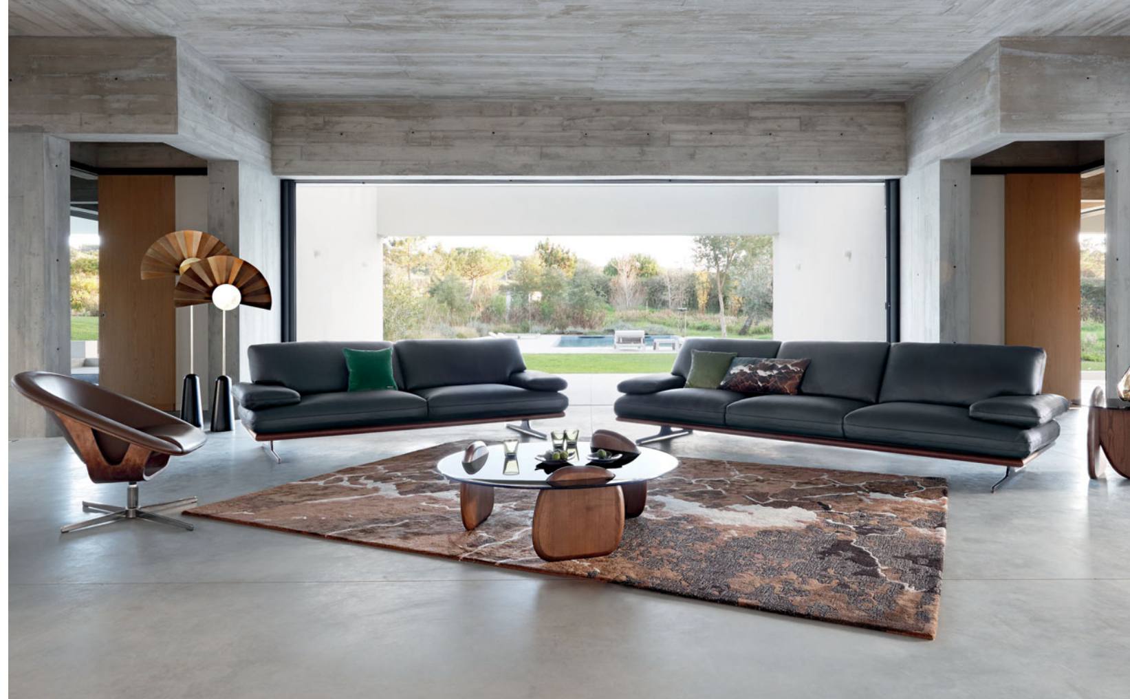
Envergure - design Philippe Bouix Sofá em pele plena flor, base em faia maciça

Mesa e cadeiras certificadas FSC™ 100%: a madeira é proveniente de florestas certificados FSC™ bem geridas.