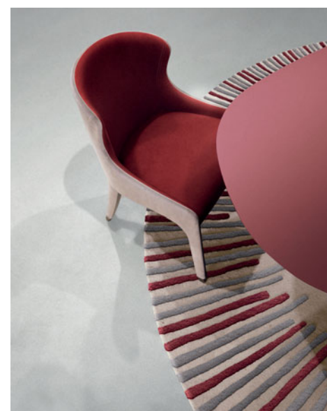
Steeple - design Enrico Franzolini

Cadeira acolchoada totalmente revestida a tecido. Estrutura em faia maciça e folheada, socos cromados. Existe noutros acabamentos. L. 56 x A. 77 x P. 58 cm. Fabrico europeu.