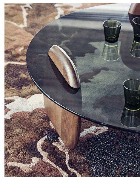
Shark - design Studio Juam

Mesa de centro com pés em freixo maciço com tinto (varias cores disponíveis) e tampo em vidro fumado cinzento (12 mm de espessura). Ø 110 x A. 33 cm. Também disponível como mesa de canto, Ø 60 x A. 46 cm. Fabrico europeu.