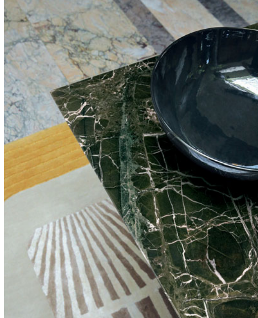
Serpentine - diseño Fabrice Berrux Mesa de comedor, sobre de mármol Verde Levanto