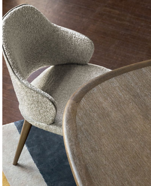
Rio Ipanema - diseño Bruno Moinard Mesa de comedor de roble macizo