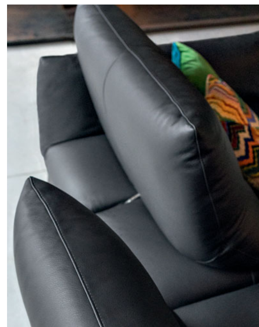
Respaldos de doble profundidad con mecanismo de balancín.