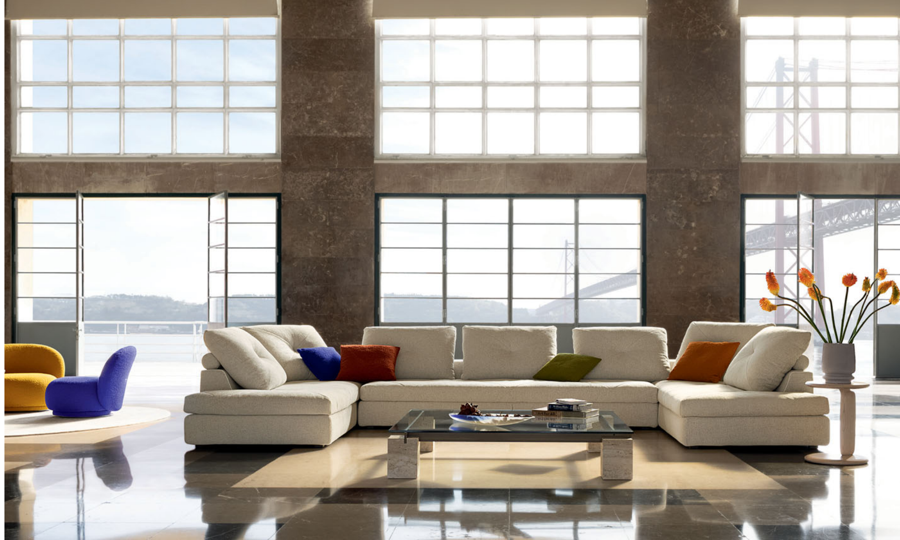
Préface - diseño Estudio Roche Bobois Sofá modular totalmente desenfundable