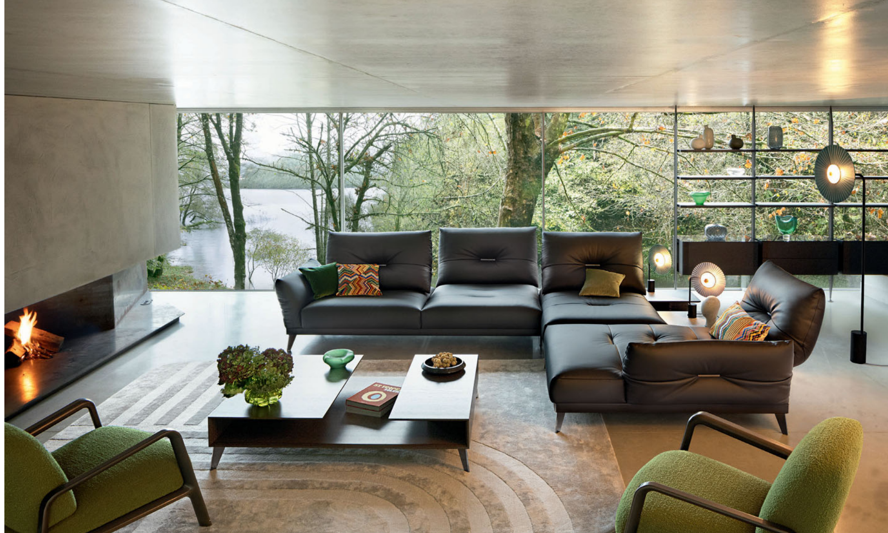
Itinéraire - diseño Philippe Bouix Sofá modular en piel, respaldos de doble profundidad con mecanismo de balancín