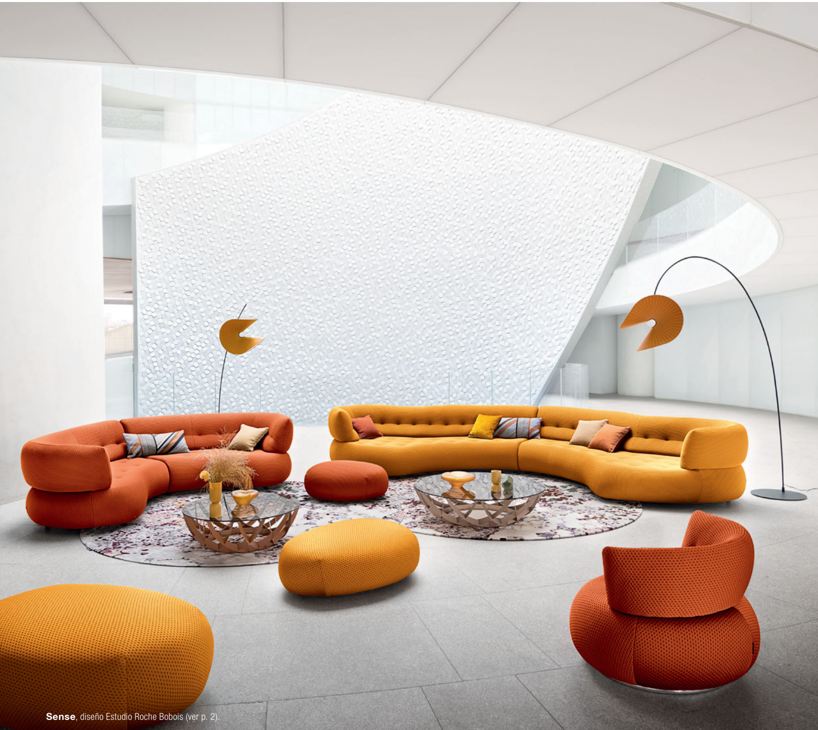
Sense, diseño Estudio Roche Bobois (ver p. 2).