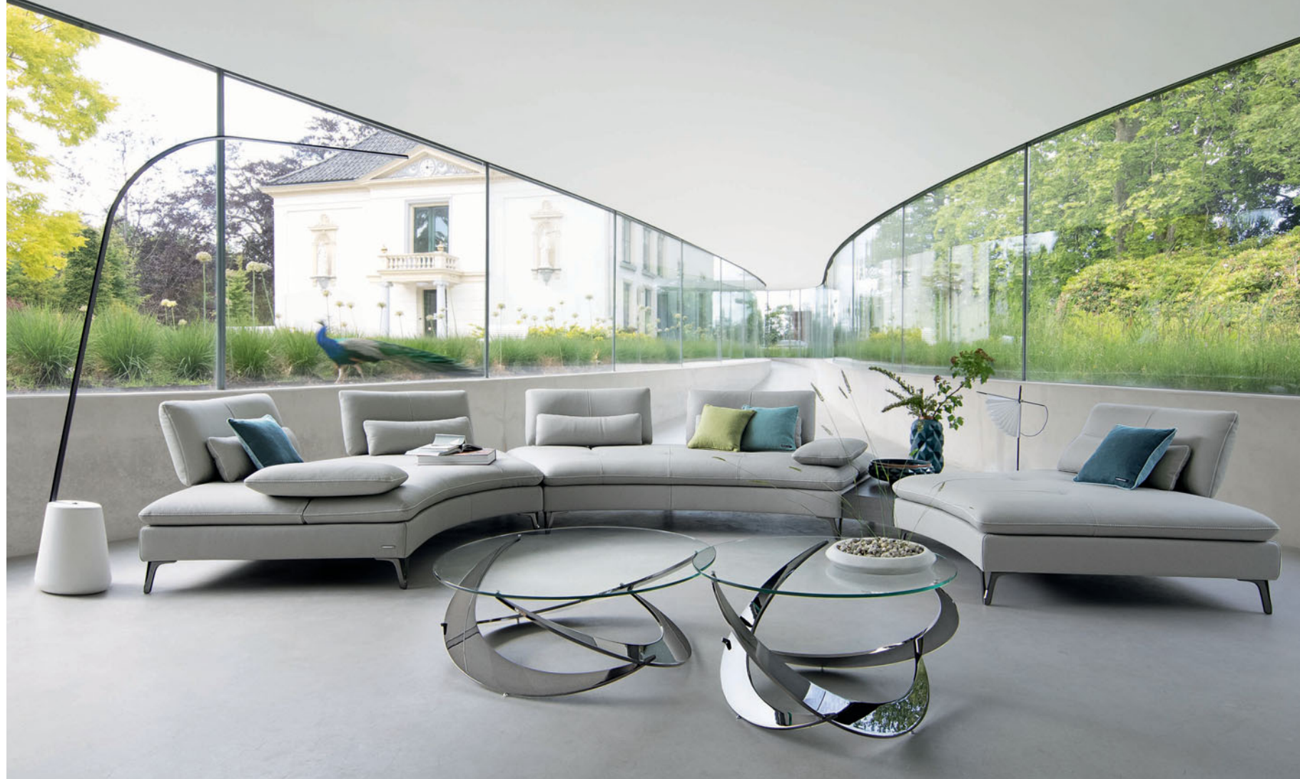
Scénario 2 - diseño Sacha Lakic Sofá modular, respaldos de doble profundidad con mecanismo de balancín