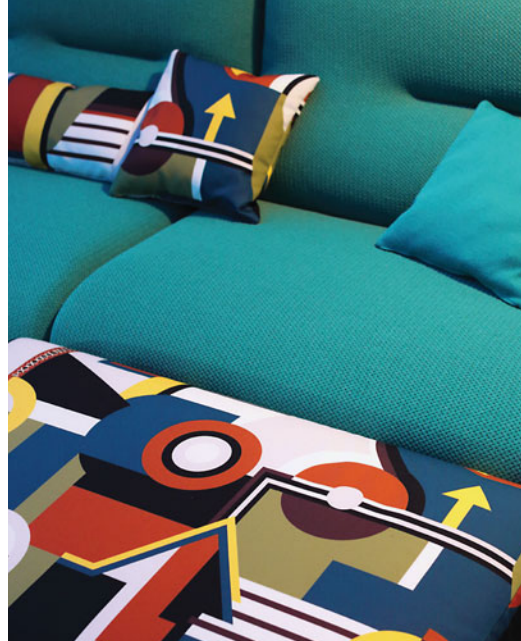
Tela de exterior Constructivisme Jean Paul Gaultier.