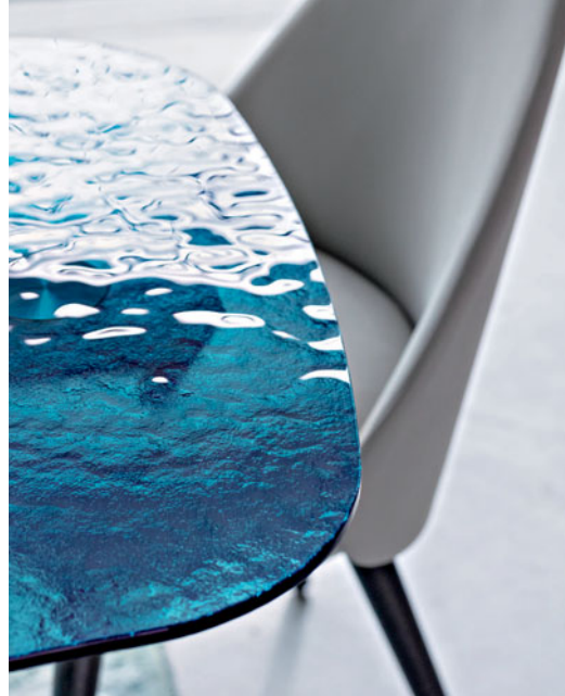
Iroise - diseño Estudio Roche Bobois Mesa de comedor, sobre de vidrio martillado