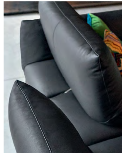
Dossiers à double profondeur avec mécanisme à balancier.