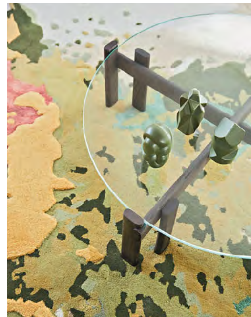
Paris Paname - design Bruno Moinard

Table basse. Plateau verre extra clair épaisseur 15 mm. Structure en chêne massif teinte sienne (défibré), Ø 117 x H. 32 cm. Fabrication européenne.