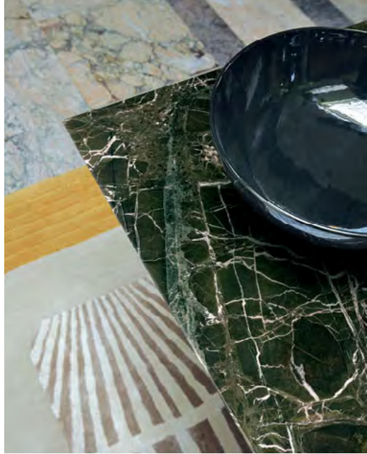
Serpentine - design Fabrice Berrux Table de repas, plateau en marbre Verde Levanto