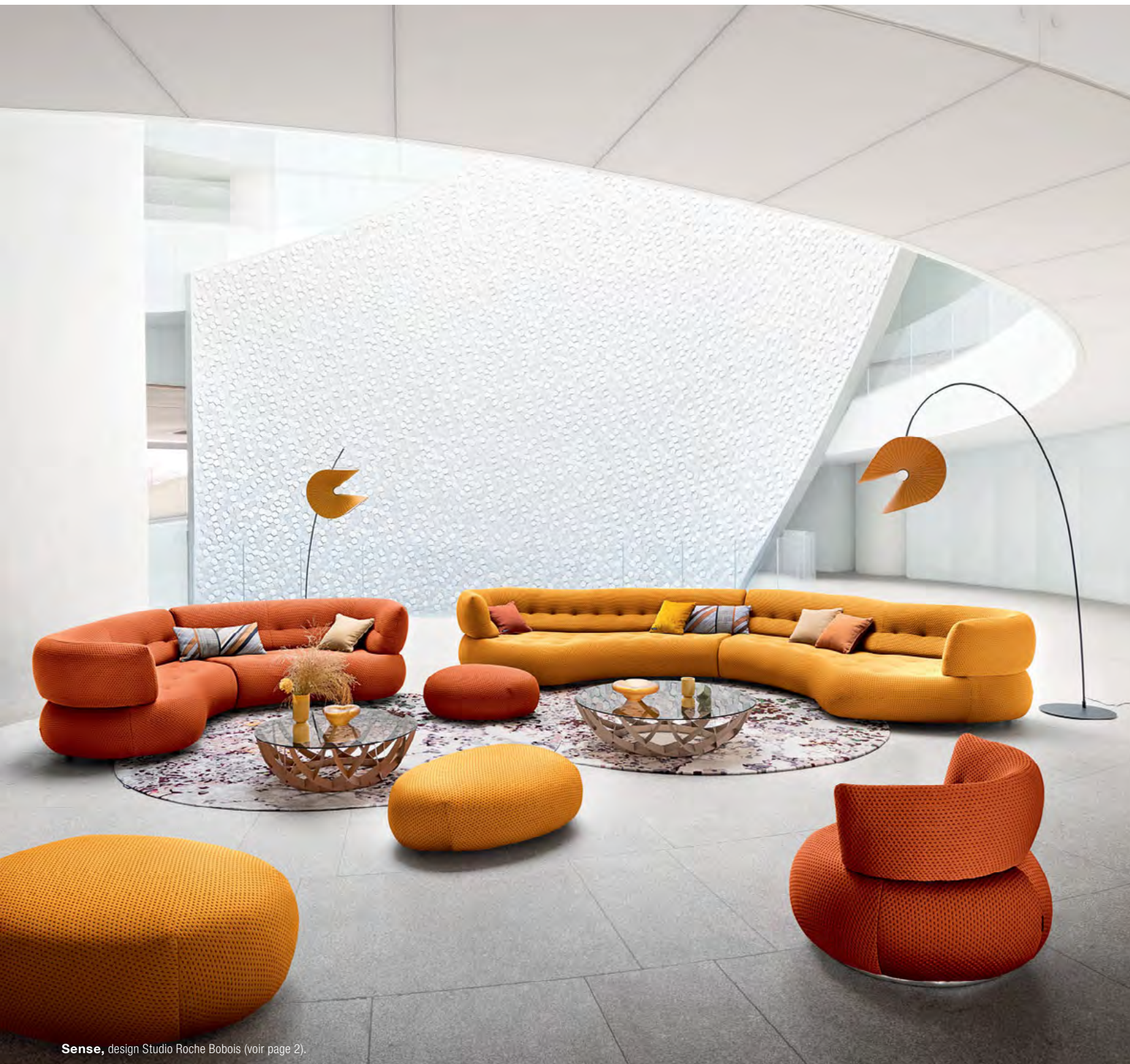
Sense , design Studio Roche Bobois (voir page 2).