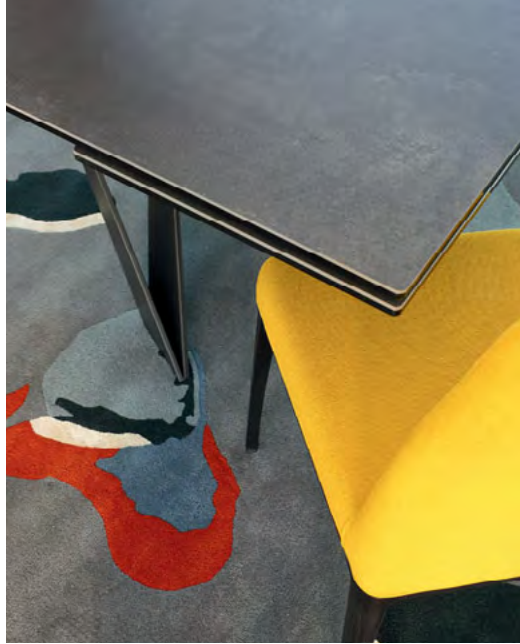
Cigale - design Andrea Casati Table de repas avec allonges intégrées, plateau en verre et céramique