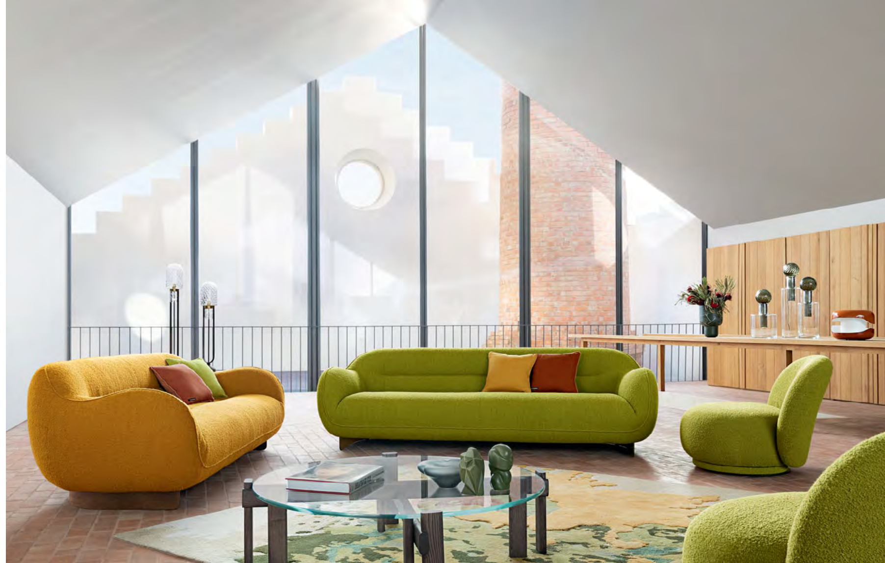
Cadence - design Maurizio Manzoni Grands canapés 3 places