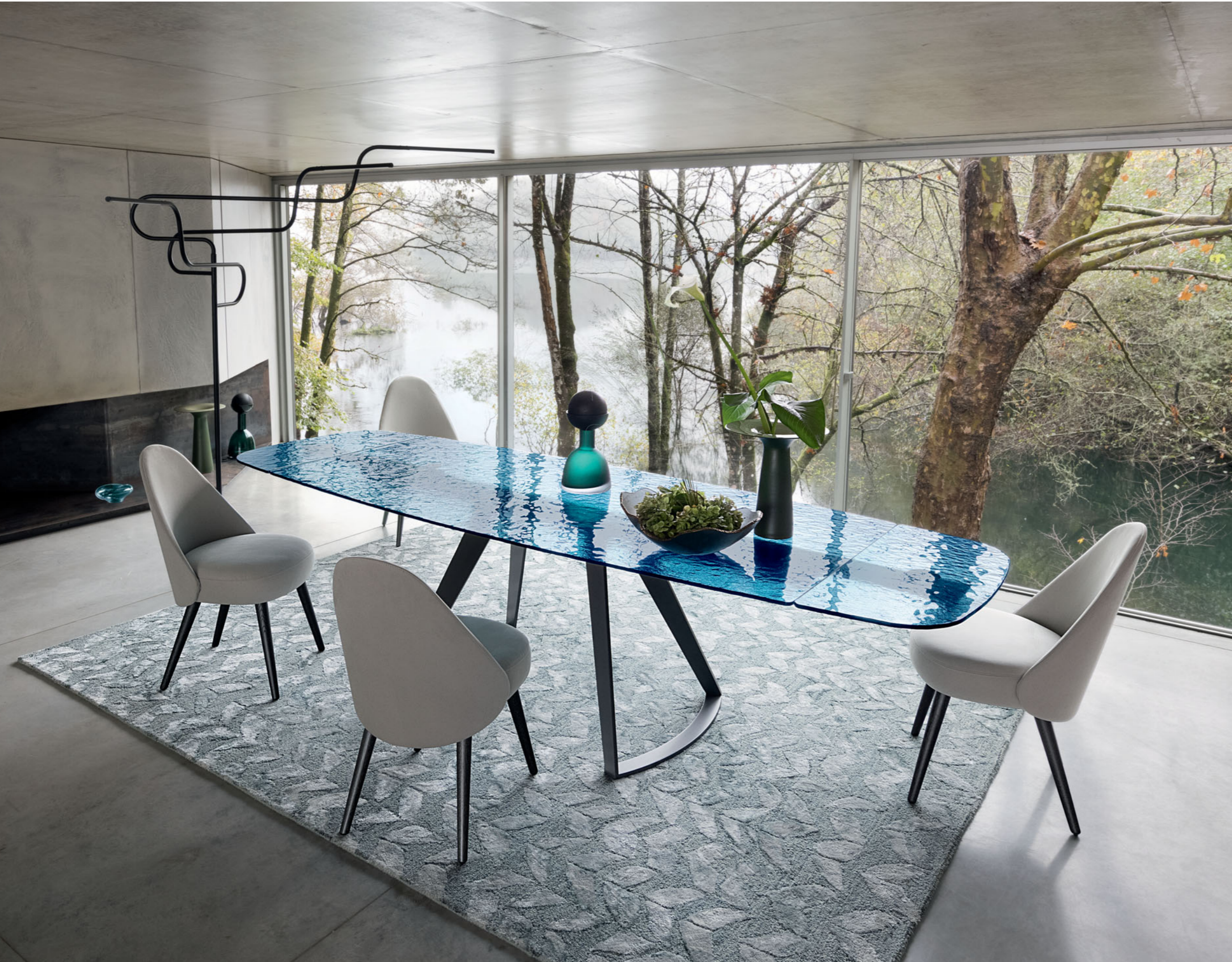
Iroise - design Studio Roche Bobois Table de repas, plateau en verre bullé