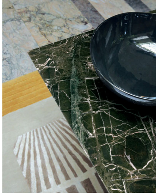
Serpentine - design Fabrice Berrux Table de repas, plateau en marbre Verde Levanto