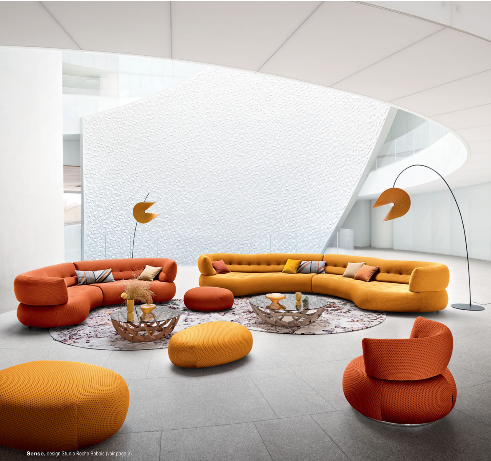
Sense , design Studio Roche Bobois (voir page 2).