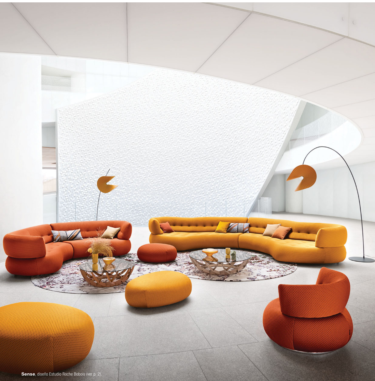
Sense, diseño Estudio Roche Bobois (ver p. 2).