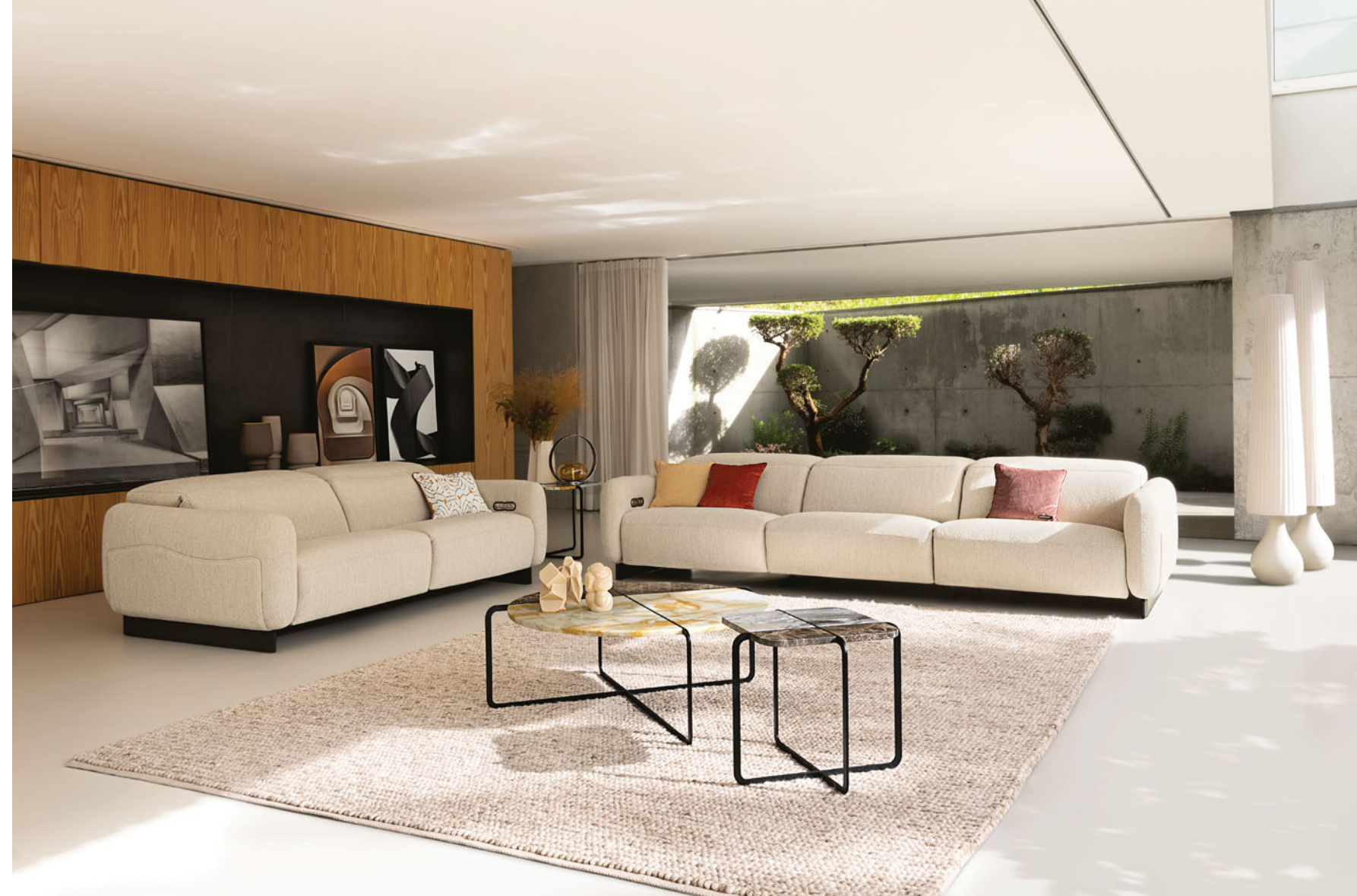
Opale - diseño Maurizio Manzoni Sofá modular con mecanismo eléctrico multiposición