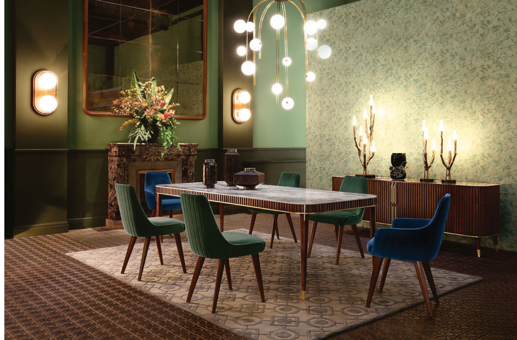
Edén Rock - diseño Sacha Lakic Mesa de comedor, sobre en mármol de Carrara