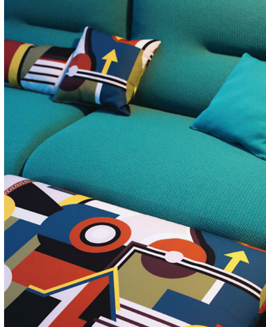
Tela para exterior Constructivisme Jean Paul Gaultier.