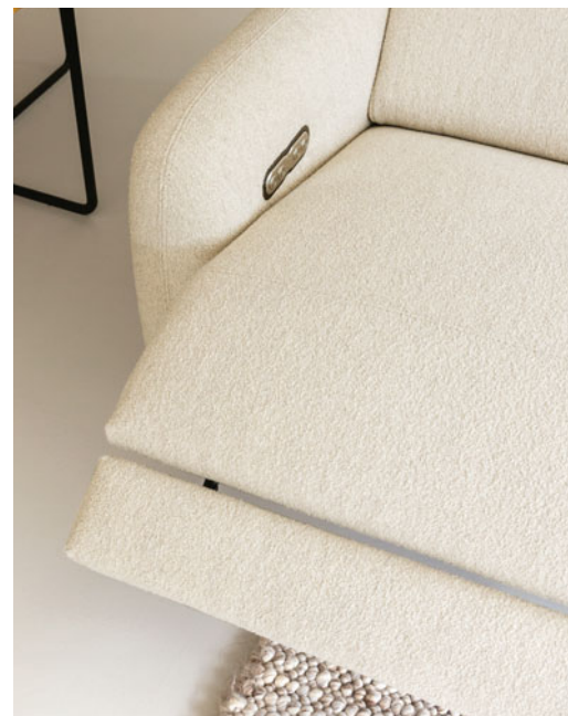
Mecanismo eléctrico multiposición, respaldos elevables.