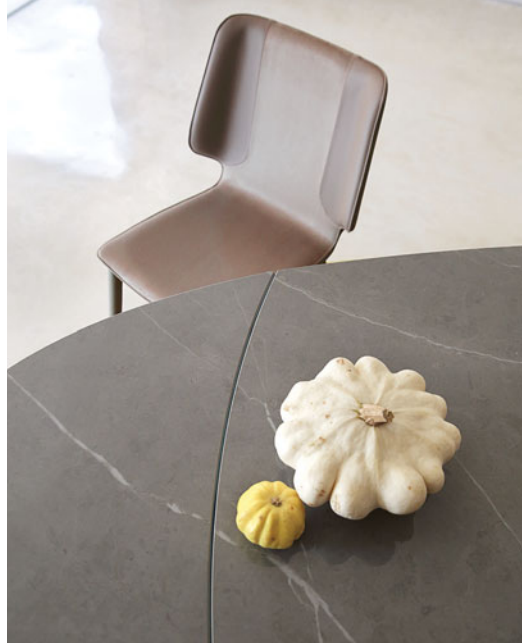
Alliage - diseño Andrea Casati Mesa de comedor con extensiones integradas, sobre de cerámica y cristal