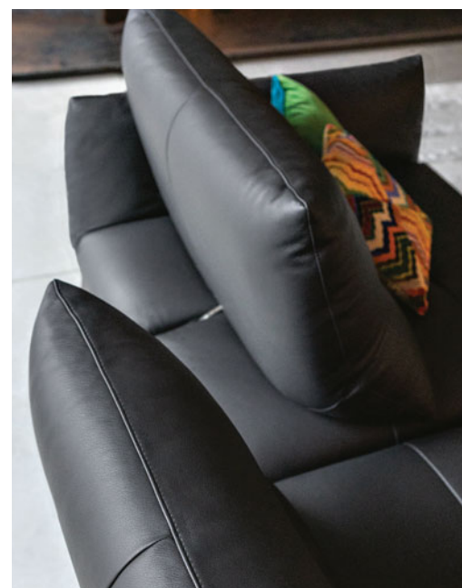
Respaldos de doble profundidad con mecanismo de balancín.

Itinéraire. Sofá modular revestido de piel Sweet, vaqueta plena flor pigmentada. Respaldos de doble profundidad con mecanismo de balancín (disponible en versión fija), apoyabrazos móviles. Cojines de asiento y apoyabrazos capitonés. Disponible en otras medidas. Biblioteca Cliffhanger, diseño Estudio Roche Bobois. Sillones Archipel, diseño Antoine Fritsch & Vivien Durisotti. Lámpara de pie y lámparas de sobremesa Rays, diseño Marta Bakowski. Fabricación europea. Alfombra Satori, diseño Alessandra Benigno.