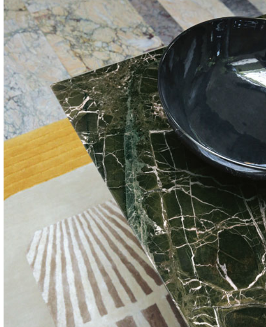
Serpentine - diseño Fabrice Berrux Mesa de comedor, sobre de mármol Verde Levanto