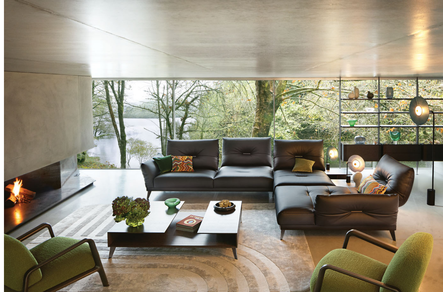
Itinéraire - diseño Philippe Bouix Sofá modular en piel, respaldos de doble profundidad con mecanismo de balancín