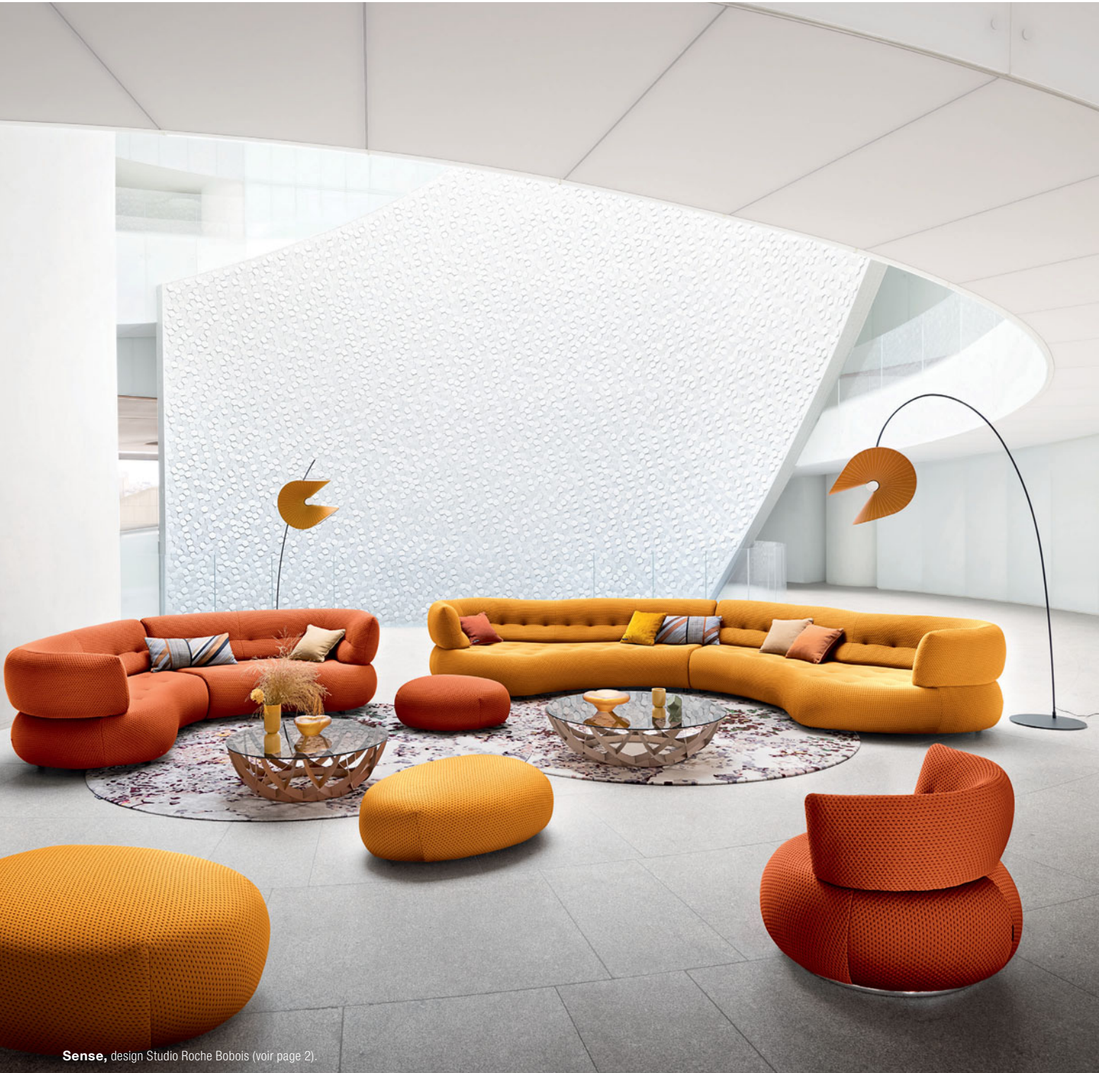
Sense , design Studio Roche Bobois (voir page 2).