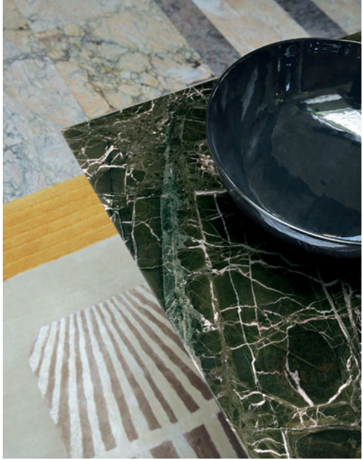
Serpentine - design Fabrice Berrux Table de repas, plateau en marbre Verde Levanto