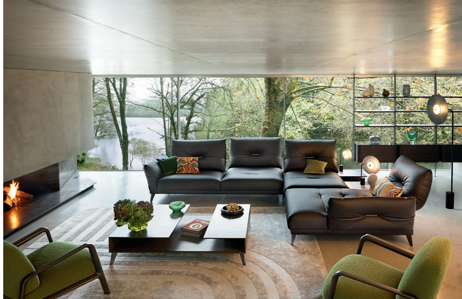
Itinéraire - design Philippe Bouix Canapé modulable en cuir pleine fleur, dossiers à double profondeur, mécanisme à balancier