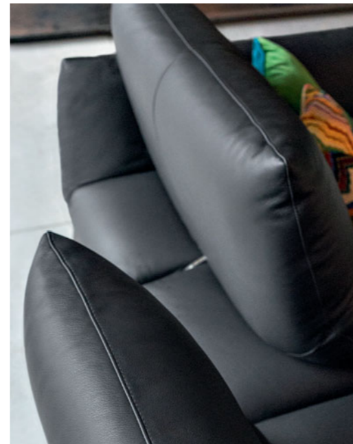
Dossiers à double profondeur avec mécanisme à balancier.