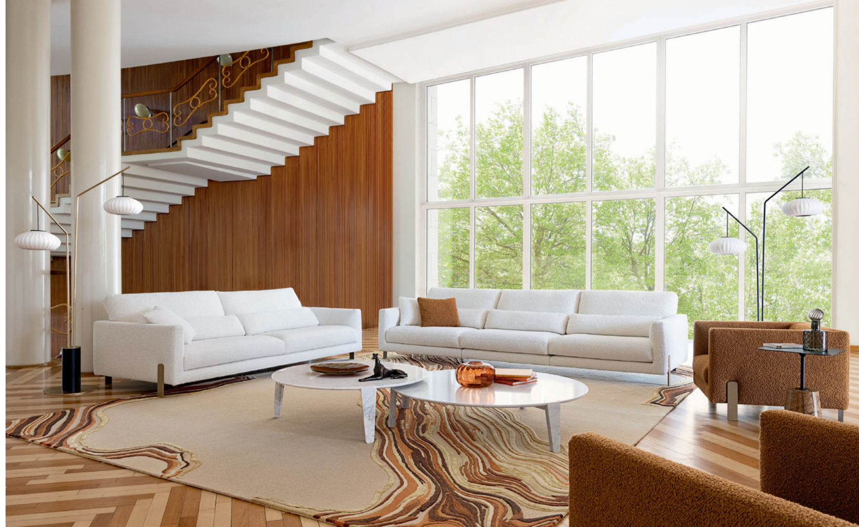
Intervalle - Design Studio Roche Bobois Großes 3-Sitzer Sofa