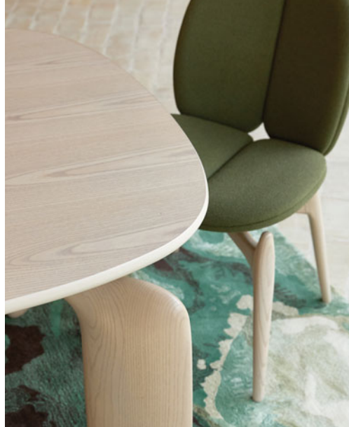
Pulp - Design Eugeni Quitllet Esstisch