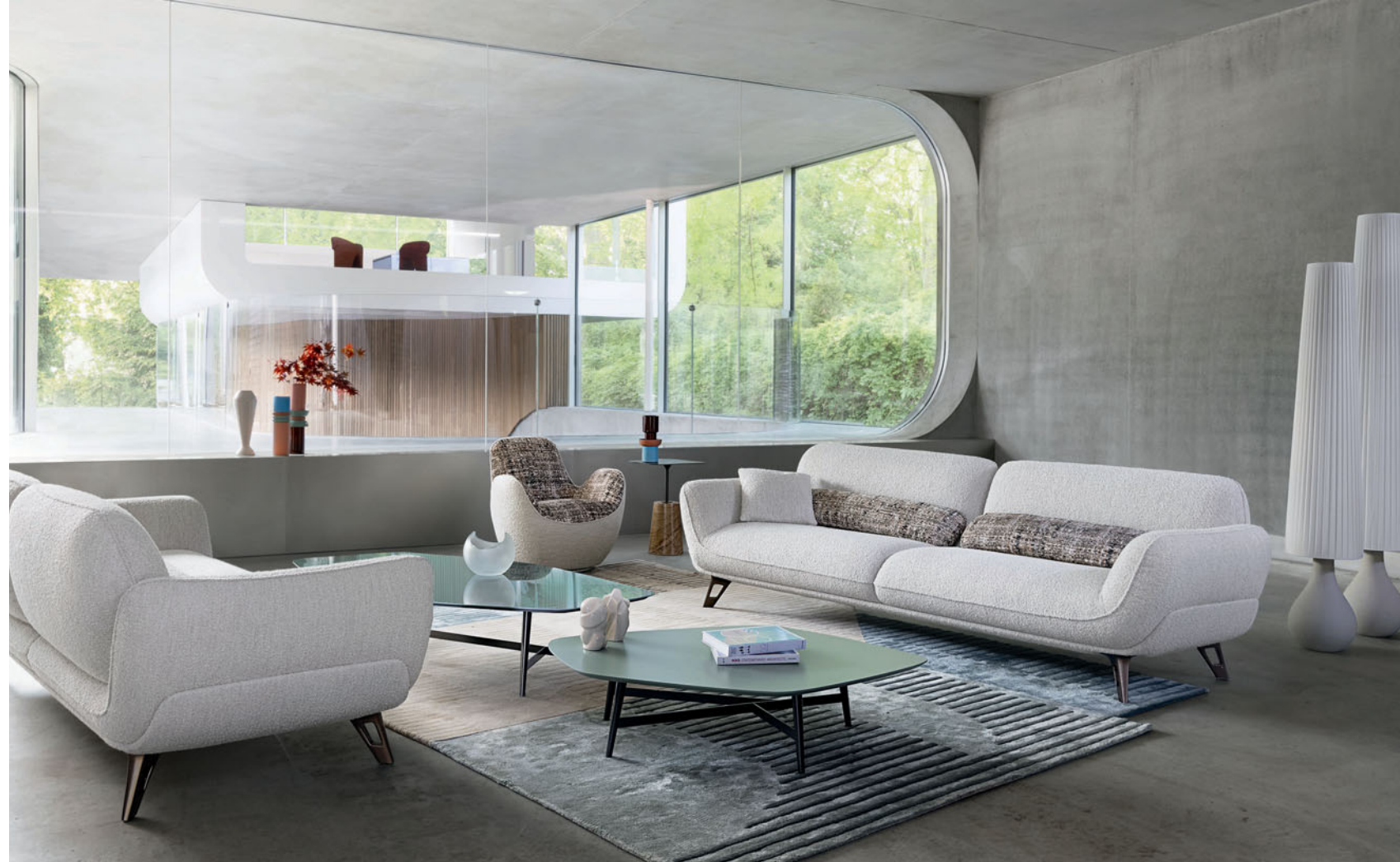
Allusion - Design Sacha Lakic Großes 3-Sitzer Sofa 3 490 €* anstatt 4 190 €