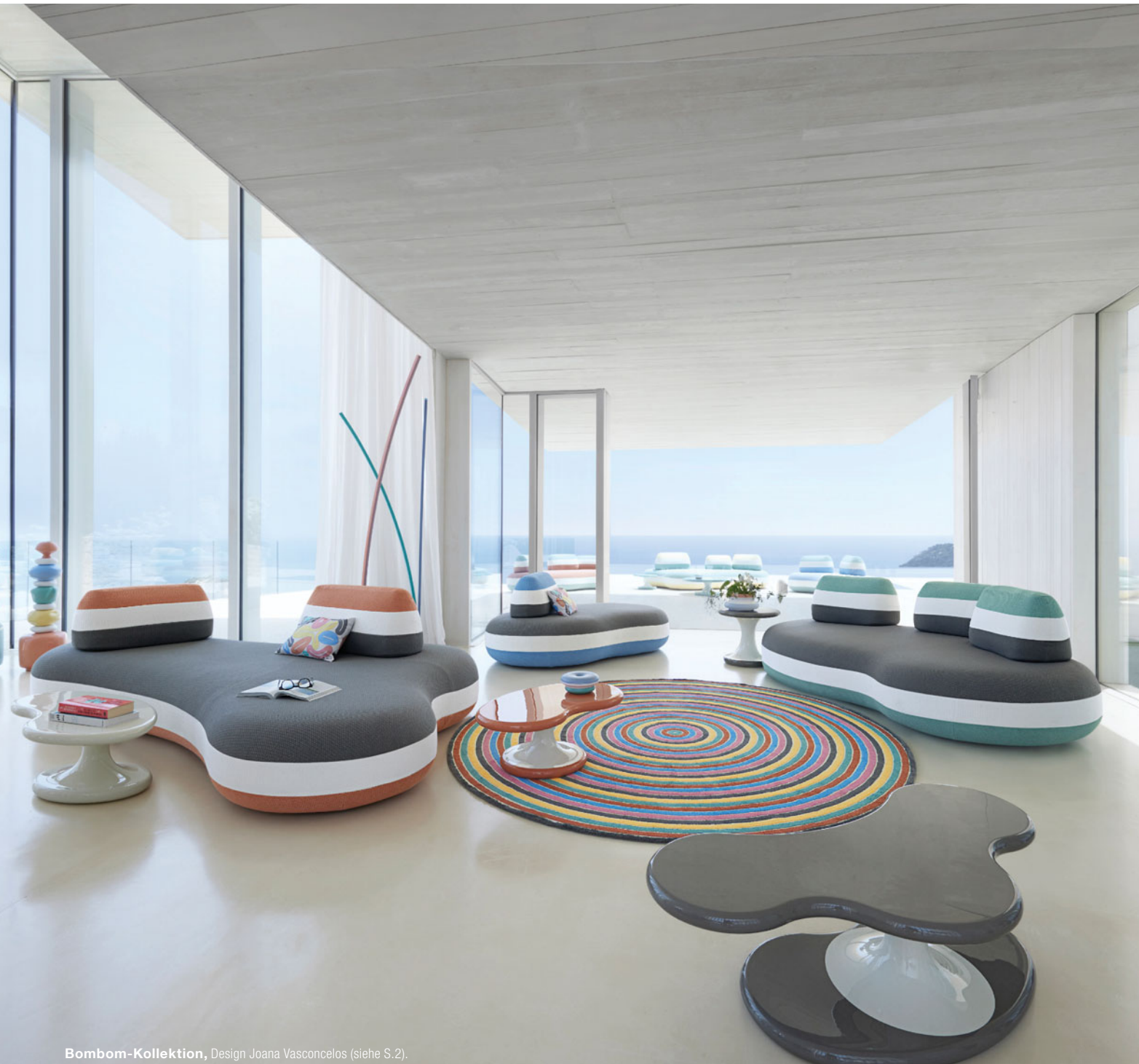
Bombom-Kollektion, Design Joana Vasconcelos (siehe S.2).