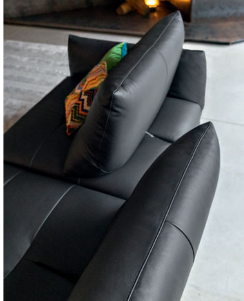
Doppeltiefe Rückenlehne mit Pendelmechanismus.