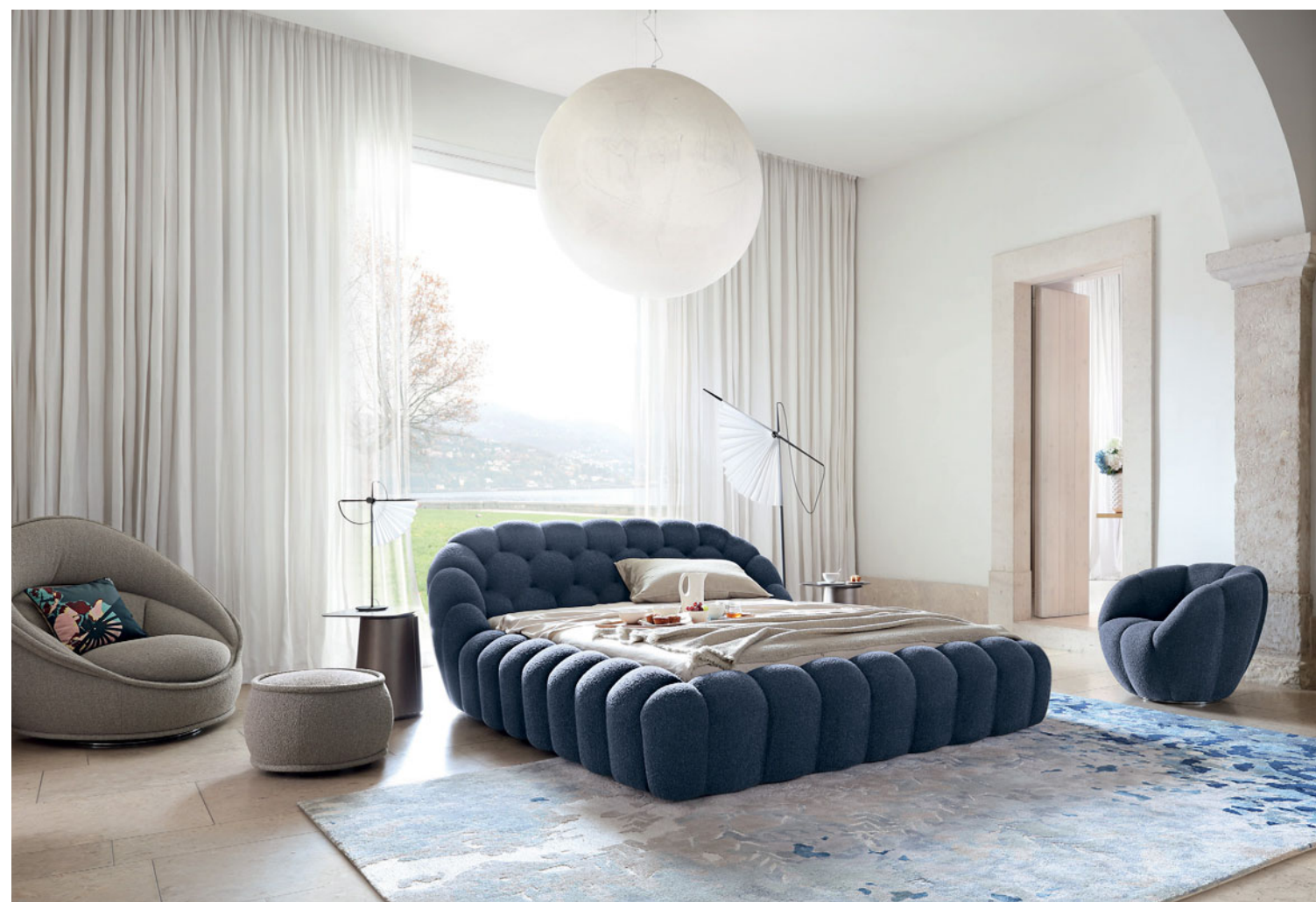
Bubble - design Sacha Lakic Cama, totalmente capitonné

Candeeiro de mesa com estrutura em metal preto e abajur em papel plissado. Duas posições de abertura para o abajur LED integrado. L. 45 x A. 60 x P. 10 cm. Fabrico europeu.