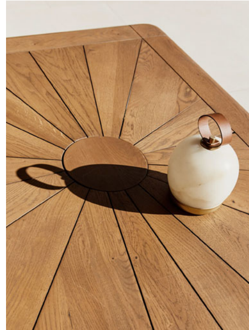
Auréa - design Sacha Lakic Mesa de jantar para exterior, em teca maciça