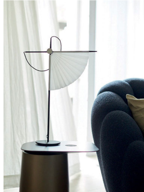
Sukato - design Elsa Pochat

Alliage. Mesa de jantar. L. 220 x A. 75 x P. 115 cm com 2 extensões integradas de 40 cm transformando a forma do tampo em oval L. 300 cm. Tampo em formato elíptico realizado em composto cerâmica/vidro (vários acabamentos disponíveis). Ilhargas em alumínio e pé em aço acabamento lacado epóxi. Existe noutros formatos, dimensões e em versão fixa. Cadeiras Kasuka, design Maurizio Manzoni. Suspensão e candeeiro de mesa Dorienne, design Martino Sasso. Fabrico europeu. Tapete Dune, design Emmanuel Gallina. Bubble. Cama revestida a tecido Orsetto Flex. L. 202 x A. 90 x P. 266 cm para colchão 160 x 200 cm. Cabeceira de cama e base capitonnés. Existe noutras dimensões de colchão. Poltrona e pouf Coiffe, design Stephen Burks. Mesas de apoio Clic, design A+A Cooren. Poltrona Astréa, design Sacha Lakic. Candeeiro de pé e de mesa Sukato, design Elsa Pochat. Fabrico europeu.