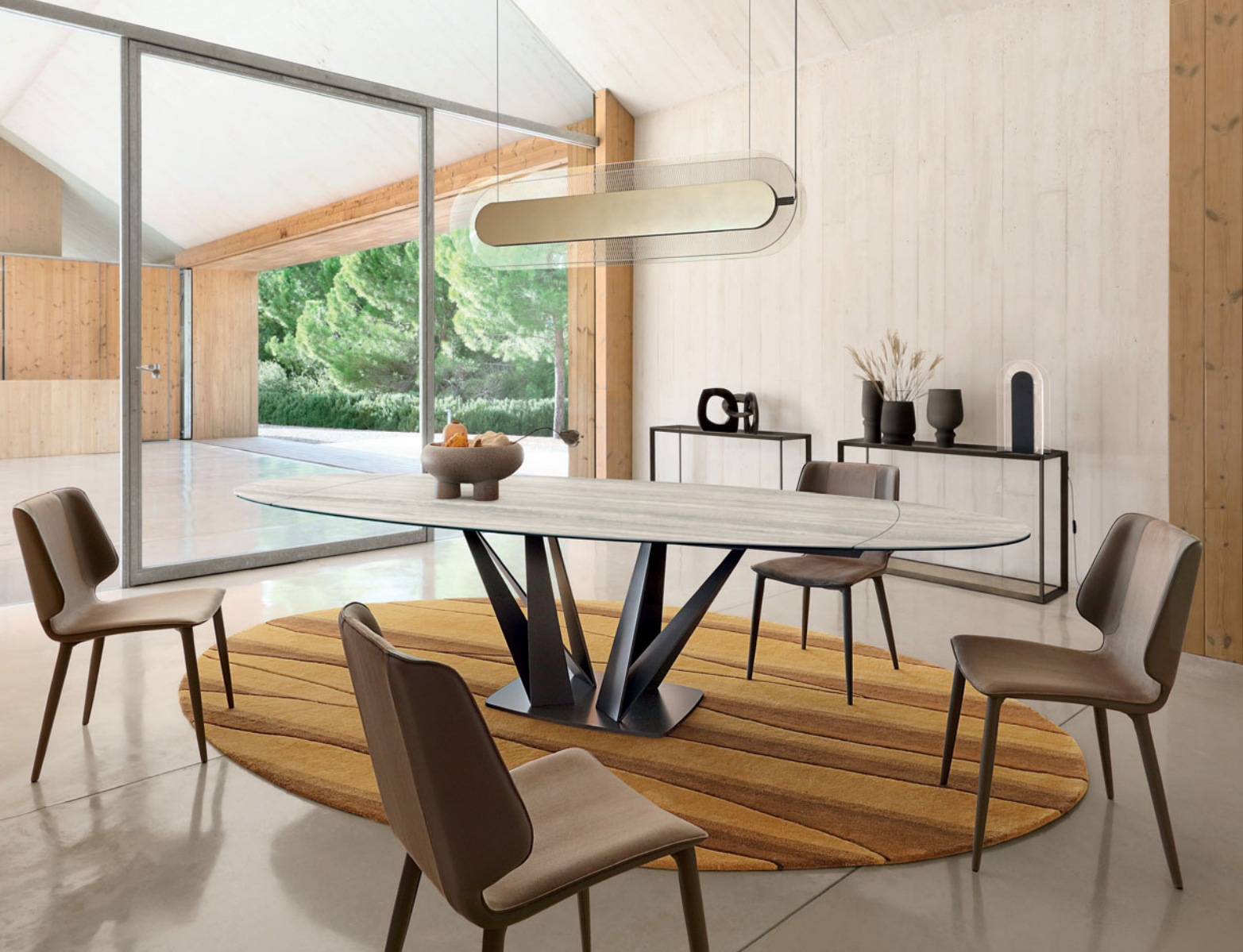
Alliage - design Andrea Casati Mesa de jantar com extensões integradas 5.790€* em vez de 6.890 €