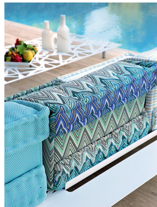
Mah Jong - design Hans Hopfer Sofá modular para o exterior

Mesa, cadeiras e banco certificados FSC™ 100%: a madeira proveniente de florestas certificadas FSC™ bem geridas.