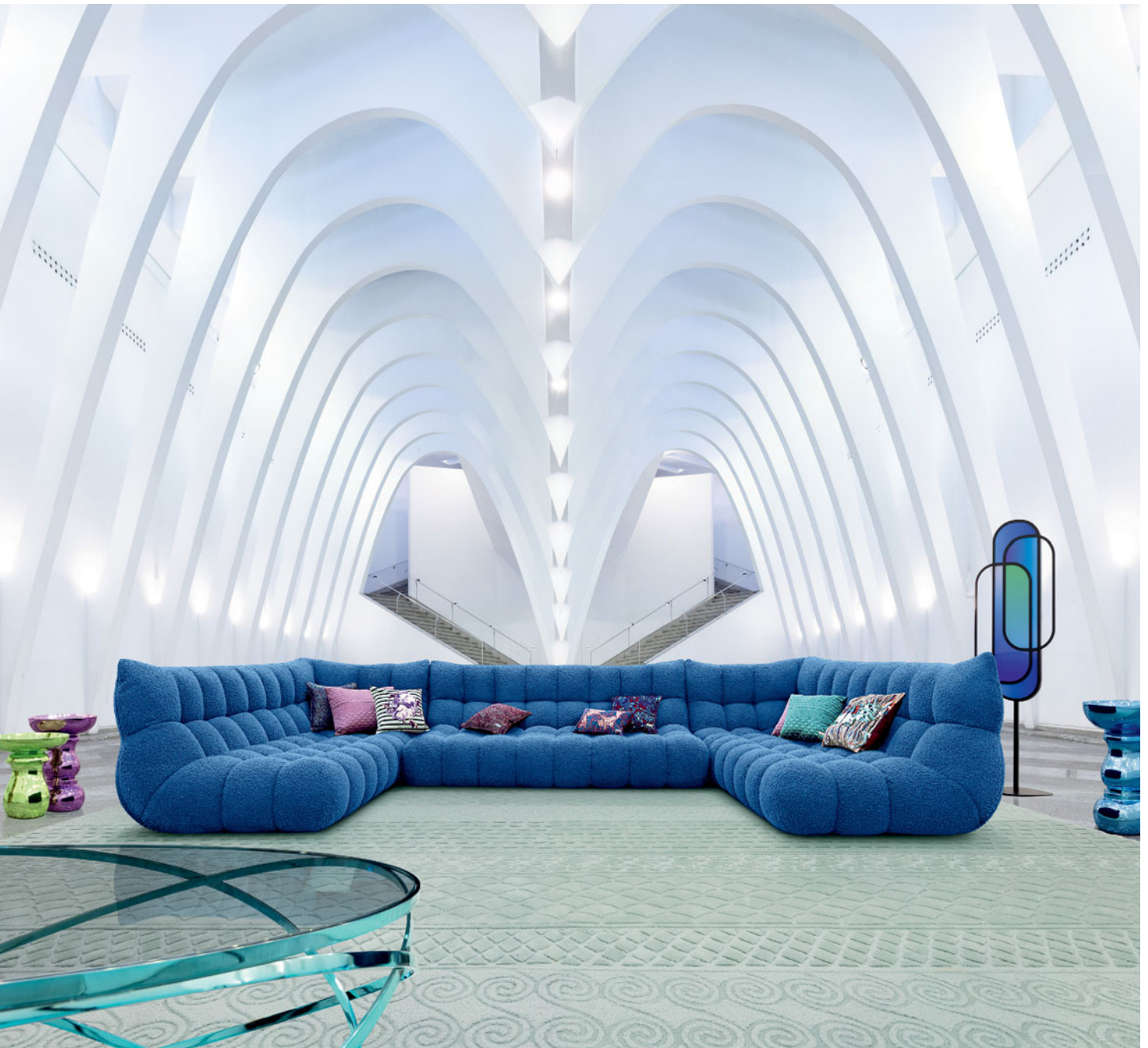
Setup, design Sacha Lakic.