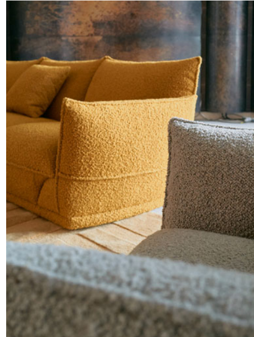
Palatine - design Christophe Delcourt Sofá grande 4 lugares