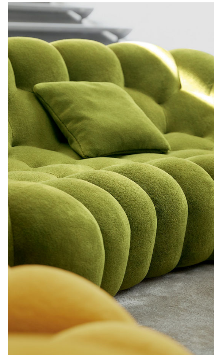
Bubble 2 - design Sacha Lakic Sofá 3-4 lugares arredondado