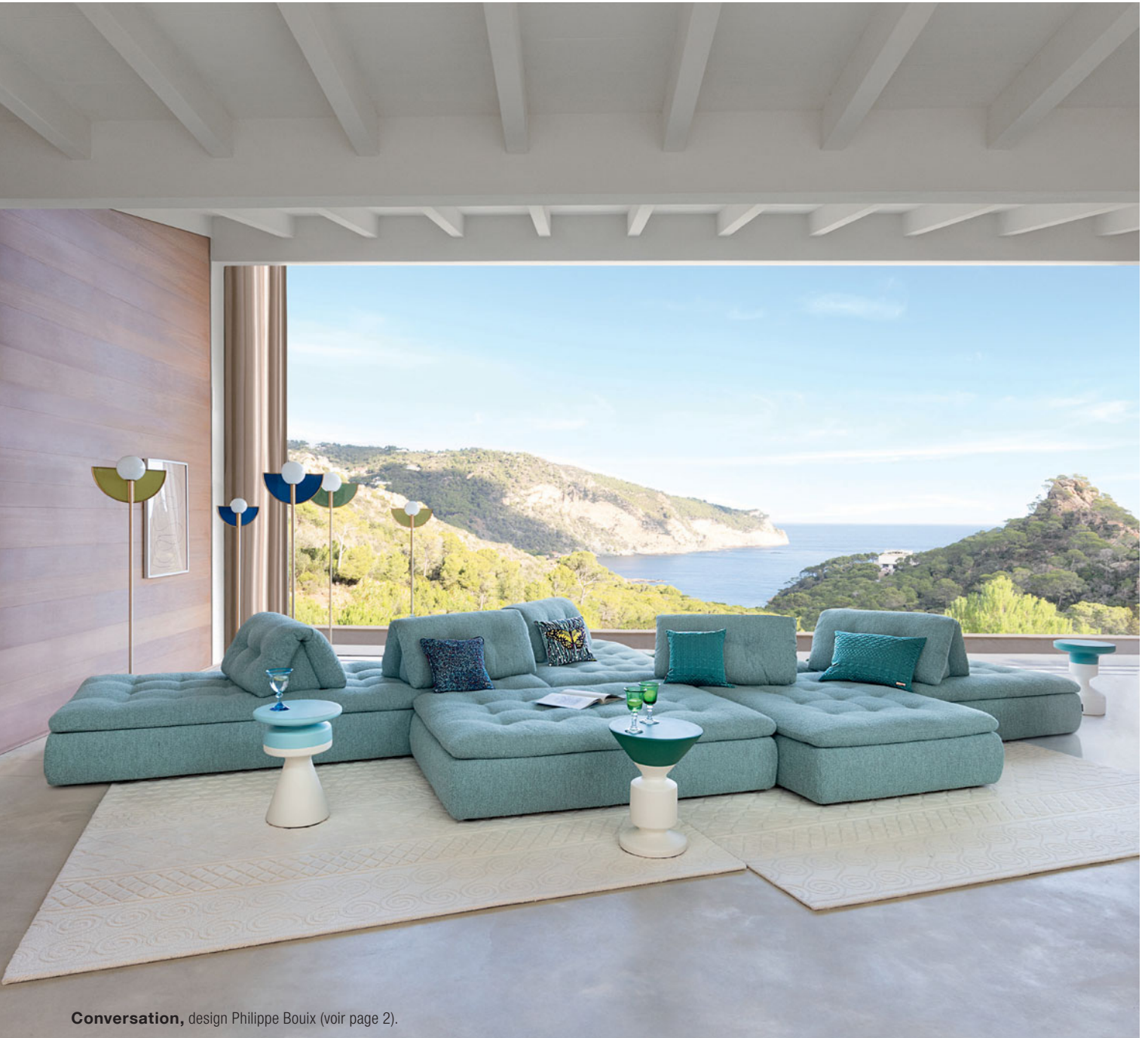
Conversation , design Philippe Bouix (voir page 2).