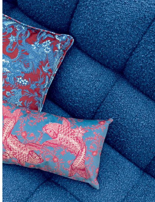
Setup - design Sacha Lakic Canapé modulaire éco-conçu, entièrement recyclable