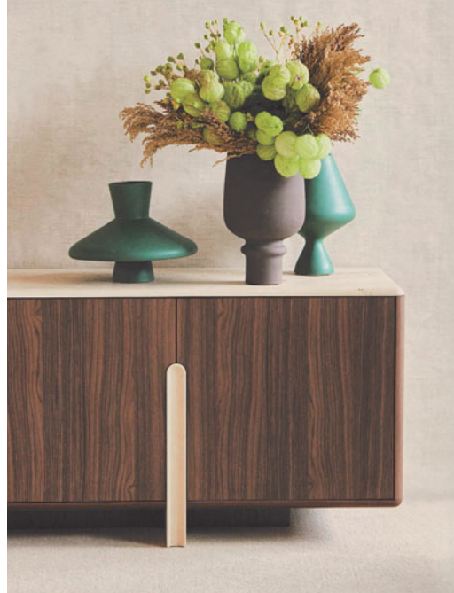
Palatine - design Christophe Delcourt Table de repas et buffet, noyer et travertin

Modèles fabriqués avec du bois FSC® mixte. Ces produits sont composés de matériaux provenant de forêts certifiées FSC® gérées de façon responsable et d'autres sources contrôlées.