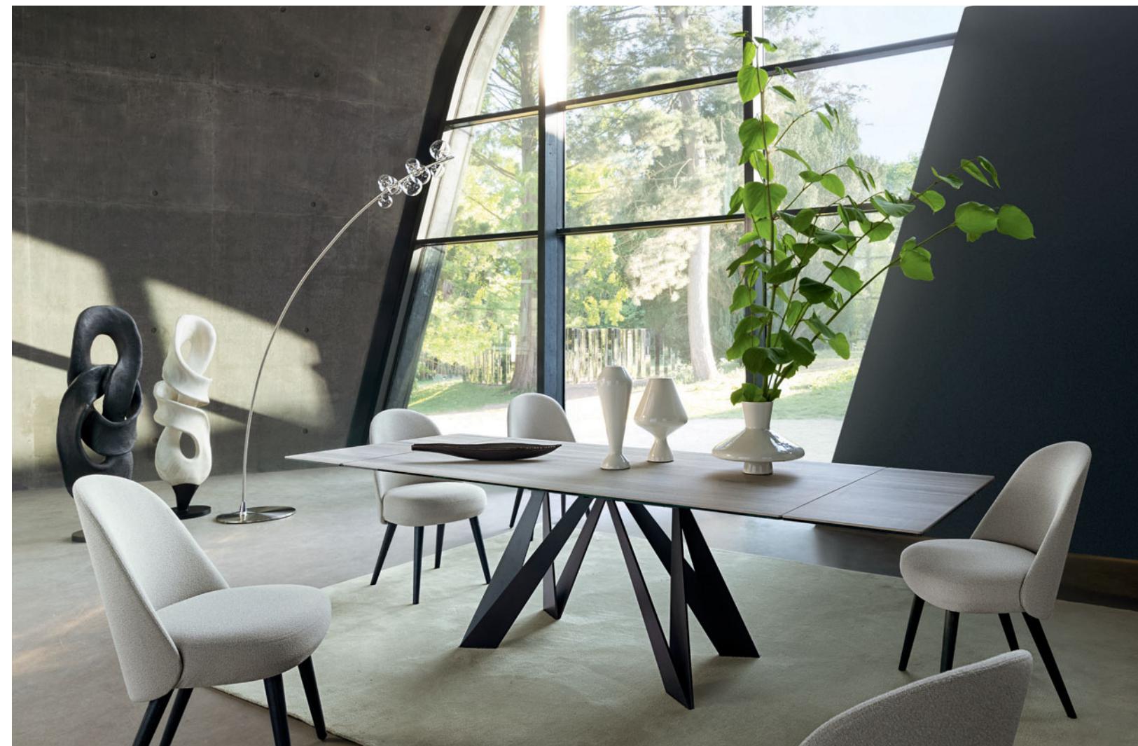
Cigale - design Andrea Casati Table de repas avec allonges intégrées, plateau verre et céramique

La structure de ce canapé est fabriquée avec du bois certifié FSC® mixte. Elle est composée de matériaux provenant de forêts certifiées FSC® gérées de façon responsable et d'autres sources contrôlées.