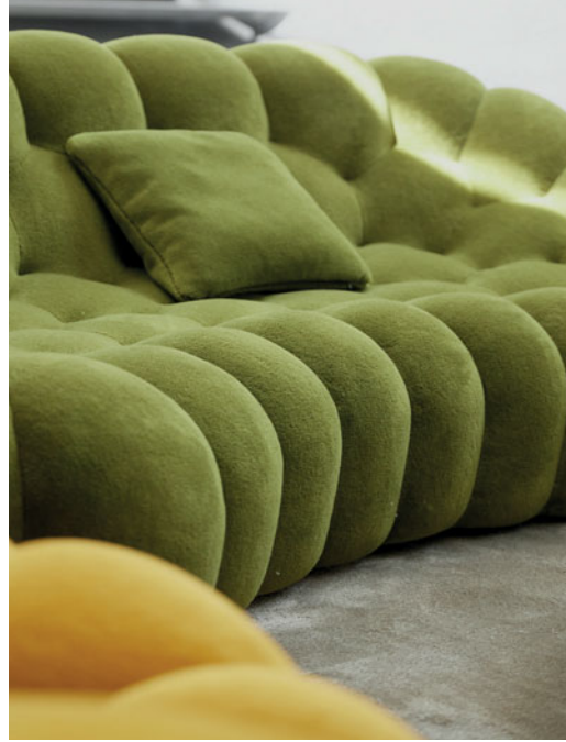
Bubble 2 - design Sacha Lakic Canapé 3-4 places arrondi