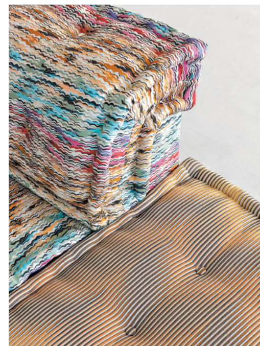
Mah Jong - design Hans Hopfer Canapé modulaire habillé de tissus Missoni

Mah Jong. Canapé modulaire habillé de tissus Missoni. Système composable à l'infini à partir de coussins d'assise (L. 95 x H. 19 x P. 95 cm), de dossiers droits, d'angle (H. 53 cm) et d'une chaise longue (L. 159 x H. 53 x P. 95 cm). Mécanisme de dossier relevable, cale-reins et petits coussins en option. Tous les éléments sont capitonnés, matelassés, réalisés à la main et posés sur des plateformes. Les encadrements et dossierets sont en chêne massif et les plateaux en Alpi® Zebrano teinte Wengé. Lampadaires et lampes à poser Twin, design Clarisse Dutraive. Fabrication européenne. Tapis Rockford, Missoni.