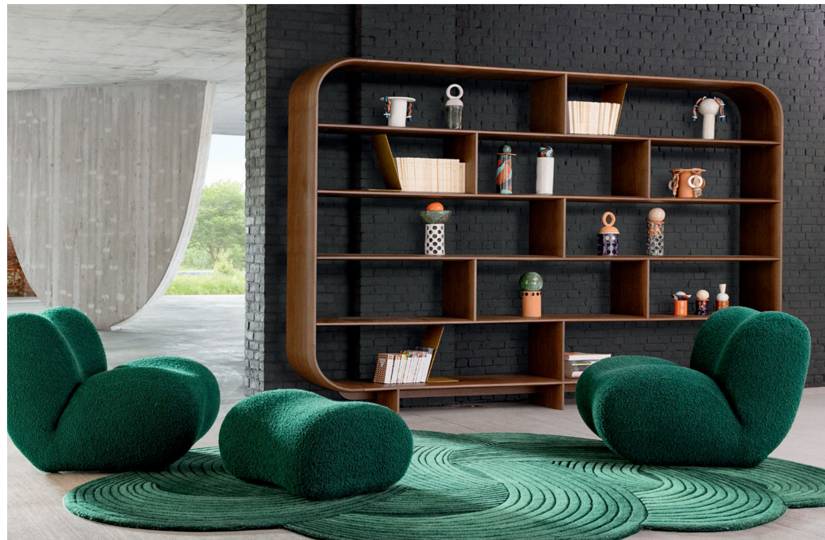
Celta - design Sacha Lakic Bibliothèque

Modèles fabriqués avec du bois FSC® mixte. Ces produits sont composés de matériaux provenant de forêts certifiées FSC® gérées de façon responsable et d'autres sources contrôlées.