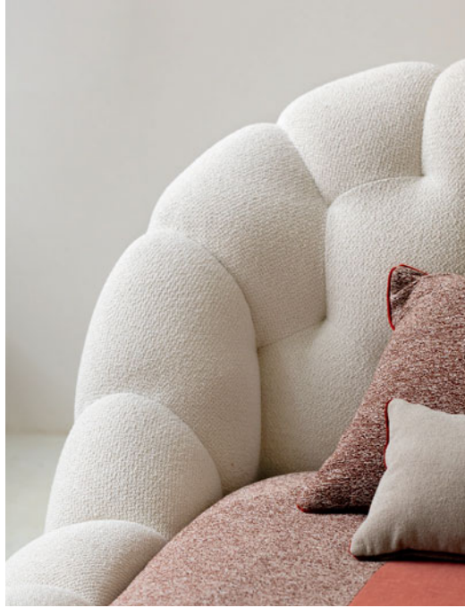
Bubble – design Sacha Lakic Lit entièrement capitonné