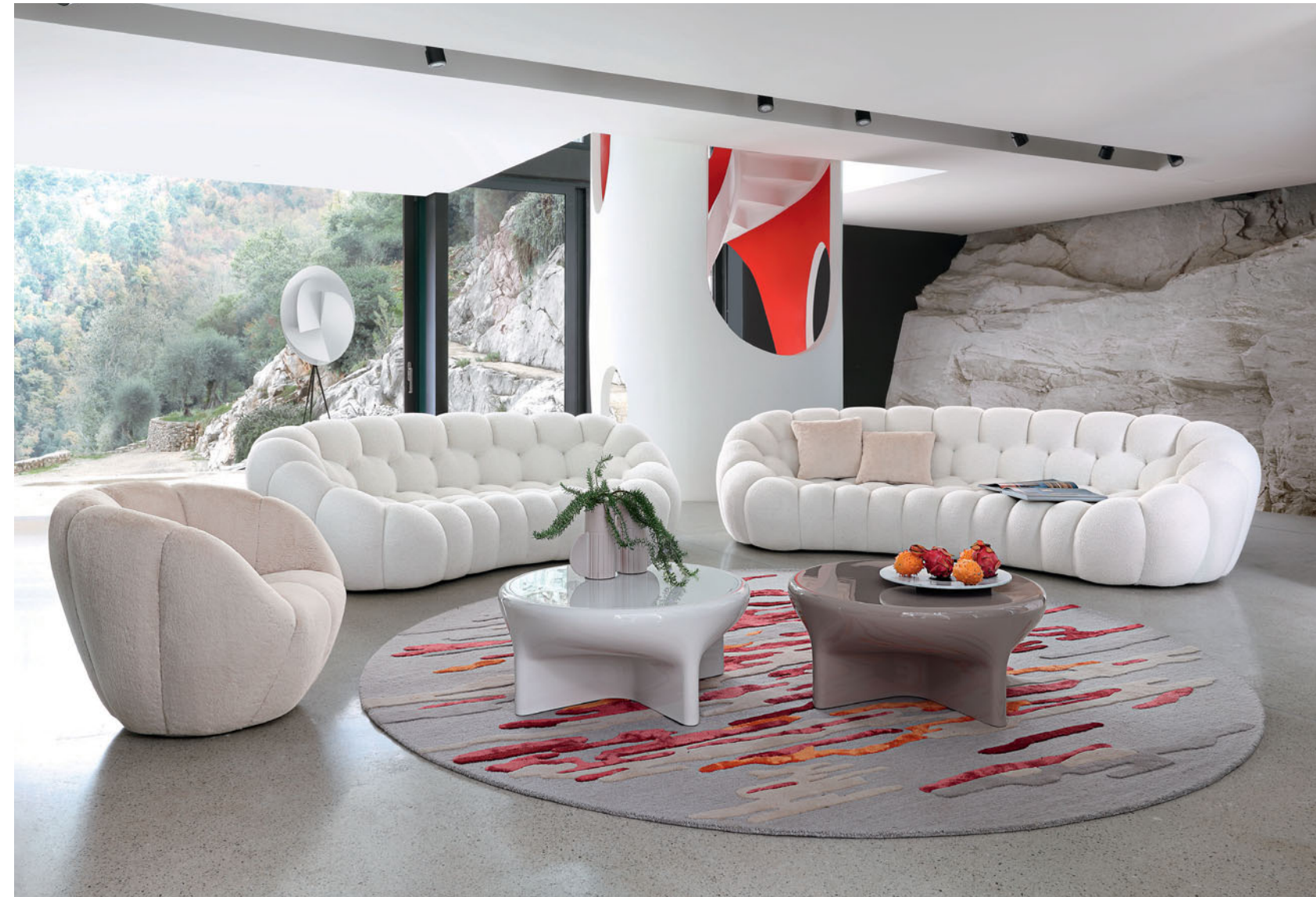
Bubble 2 – design Sacha Lakic Canapé 3-4 places arrondi