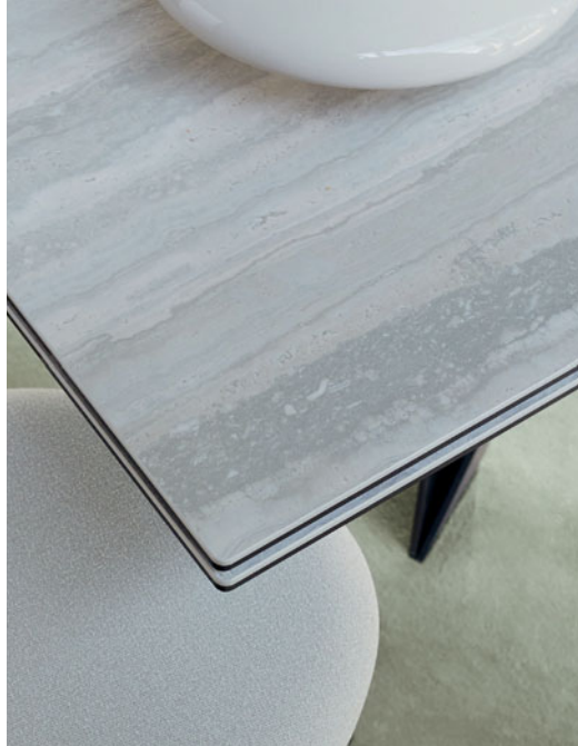
Cigale – design Andrea Casati Table de repas avec allonges intégrées, plateau verre et céramique