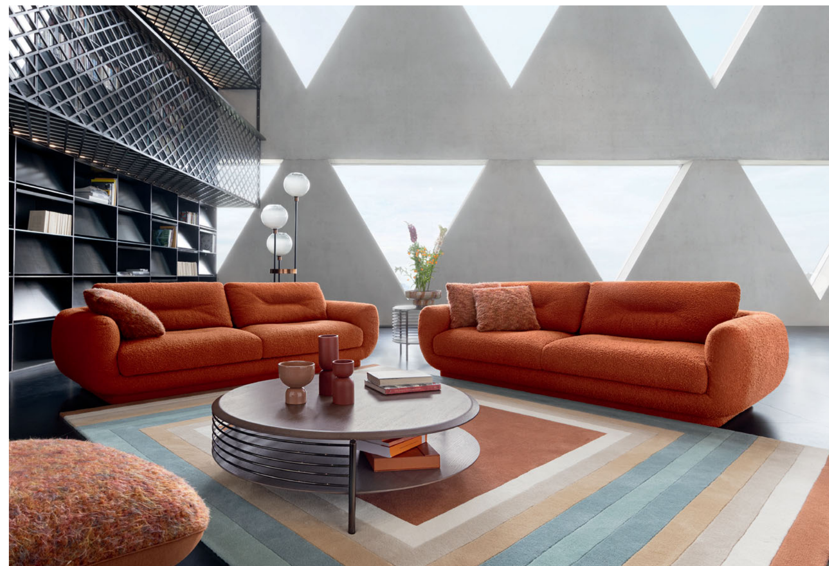
Intemporel – design Maurizio Manzoni Canapé 3-4 places, dossiers relevables