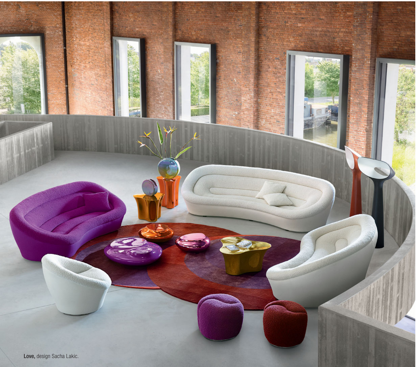
Love, design Sacha Lakic.