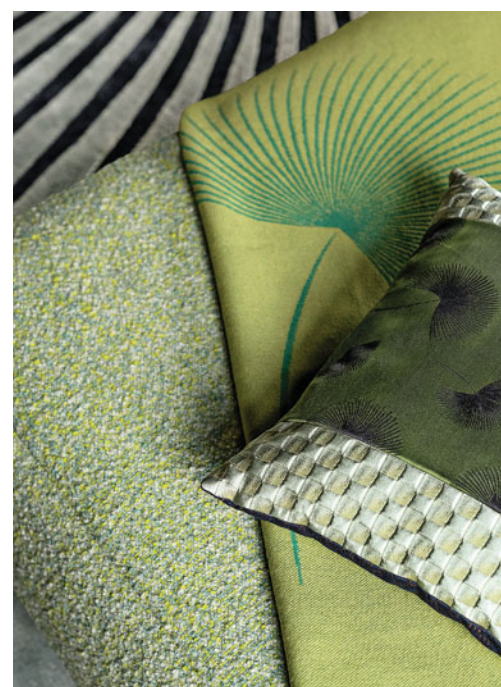
Lagune - designer Philippe Bouix Divano componibile, schienali reclinabili

La struttura della libreria è fabbricata con legno certificato FSC® misto. È composta da materiali provenienti da foreste certificate FSC® a taglio controllato e da altre fonti rinnovabili.