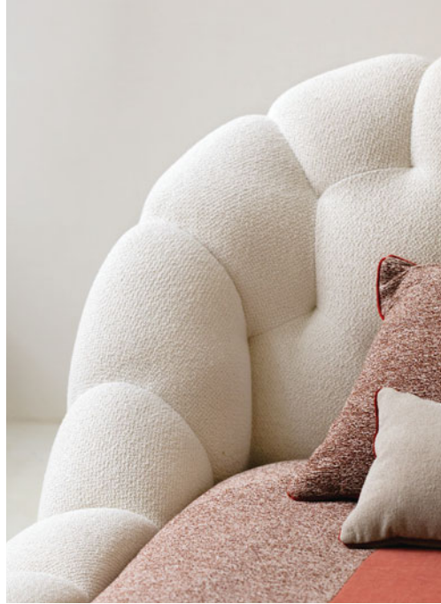
Bubble - designer Sacha Lakić Letto interamente trapuntato