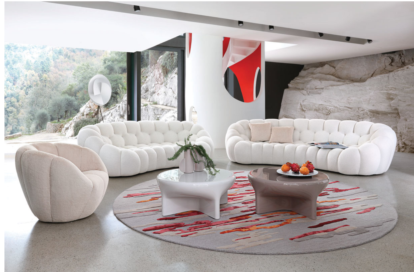
Bubble 2 - designer Sacha Lakić Divano 3-4 posti arrotondato

La struttura del letto è fabbricata con legno certificato FSC® misto. È composta da materiali provenienti da foreste certificate FSC® a taglio controllato e da altre fonti rinnovabili.