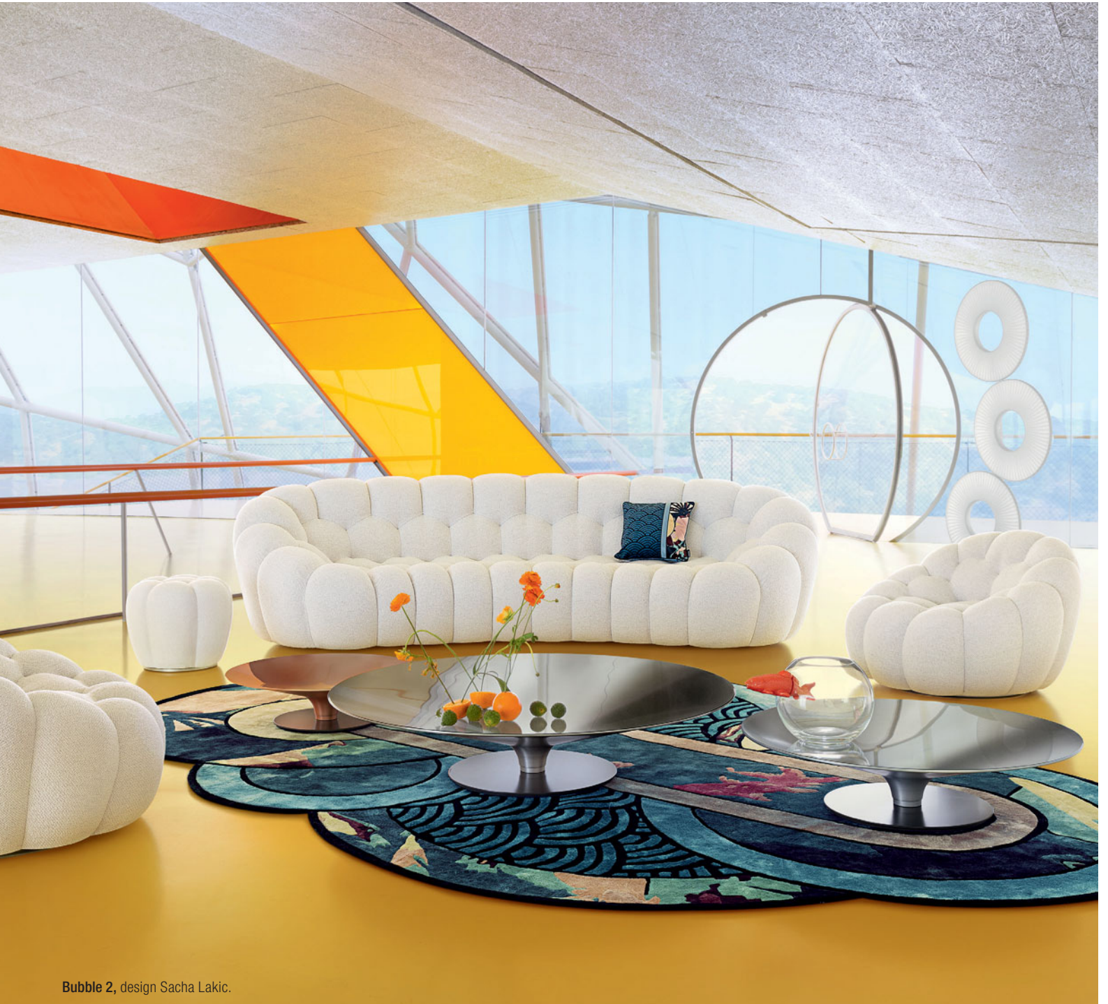
Bubble 2, design Sacha Lakic.