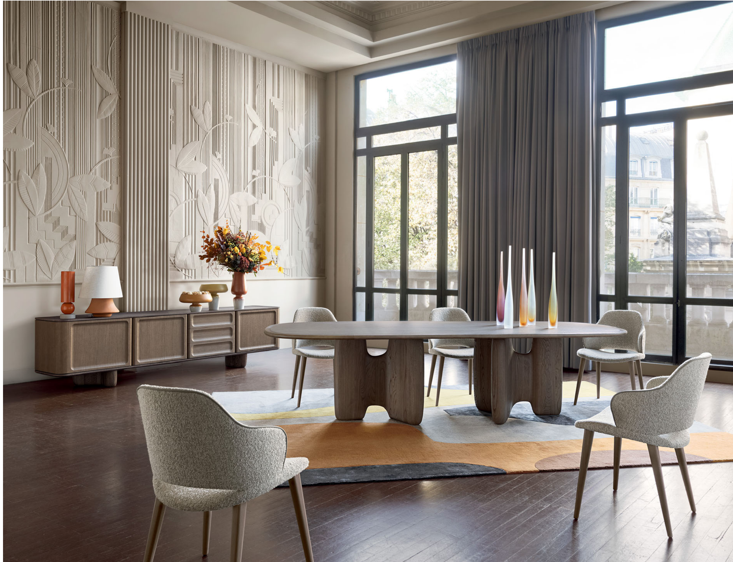
Rio Ipanema - designer Bruno Moinard Tavolo da pranzo, base in rovere e castagno massiccio

Tavolo da pranzo. L. 300 x H. 76 x P. 130 cm. Piano fisso con cornice in rovere massiccio. Base in rovere e castagno massiccio sfilato. Disponibile in altre tinte e dimensioni. Buffet Rio Ipanema, designer Bruno Moinard. Sedie con braccioli Yel, designer Fred Rieffel. Fabbricazione europea. Tappeto Orella.