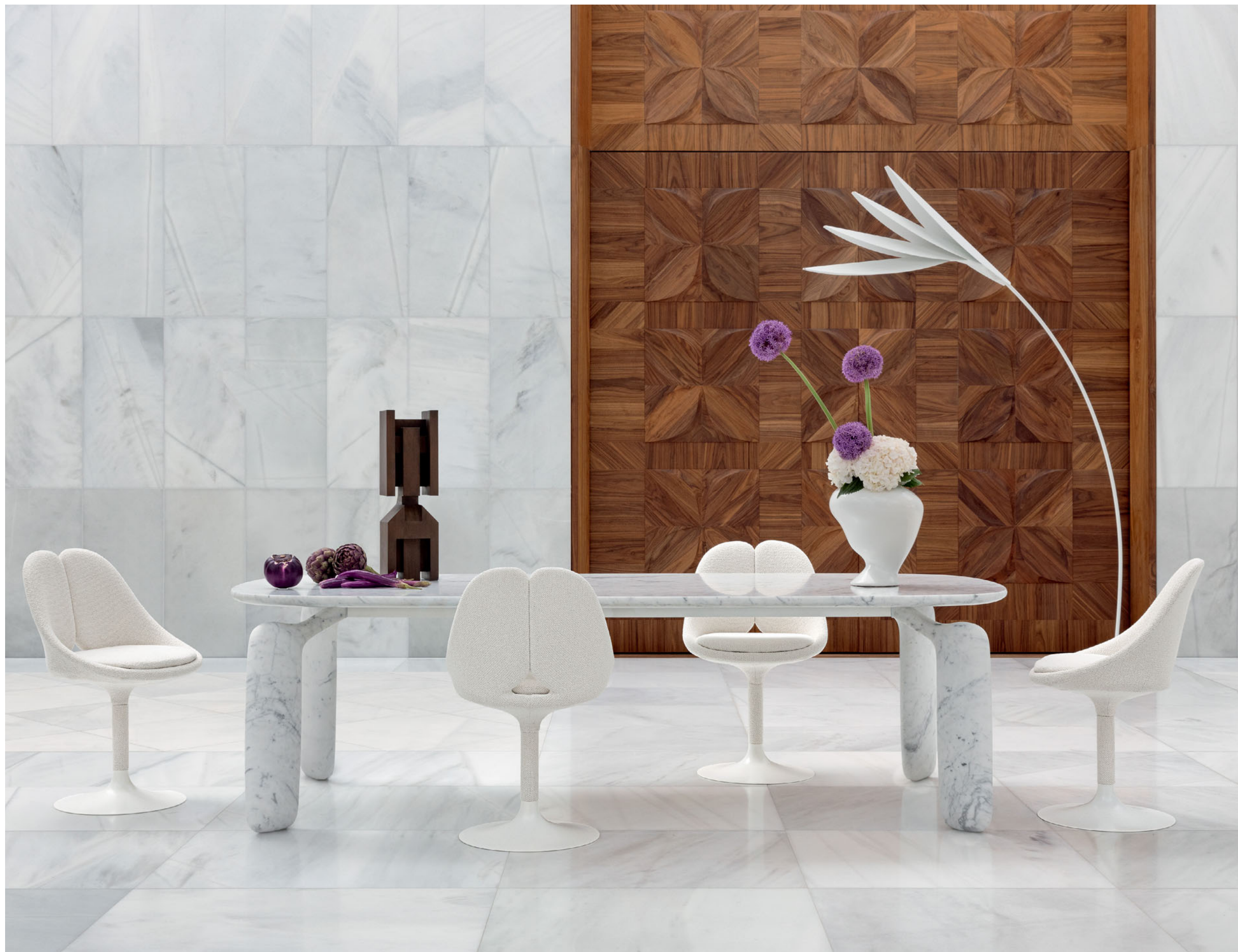
Pulp - designer Eugeni Quitllet Tavolo da pranzo in marmo di Carrara

Tavolo da pranzo. L. 250 x H. 75 x P. 110 cm. Piano e base in marmo di Carrara bianco, con struttura in metallo. Edizione numerata. Sedie Qiss, designer Eugeni Quitllet. Lampada da terra Flou, designer Sophie Langer. Fabbricazione europea.