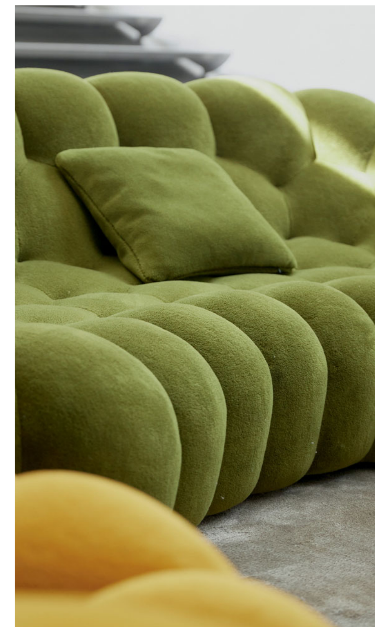
Bubble 2 - designer Sacha Lakic Divano 3-4 posti arrotondato trapuntato