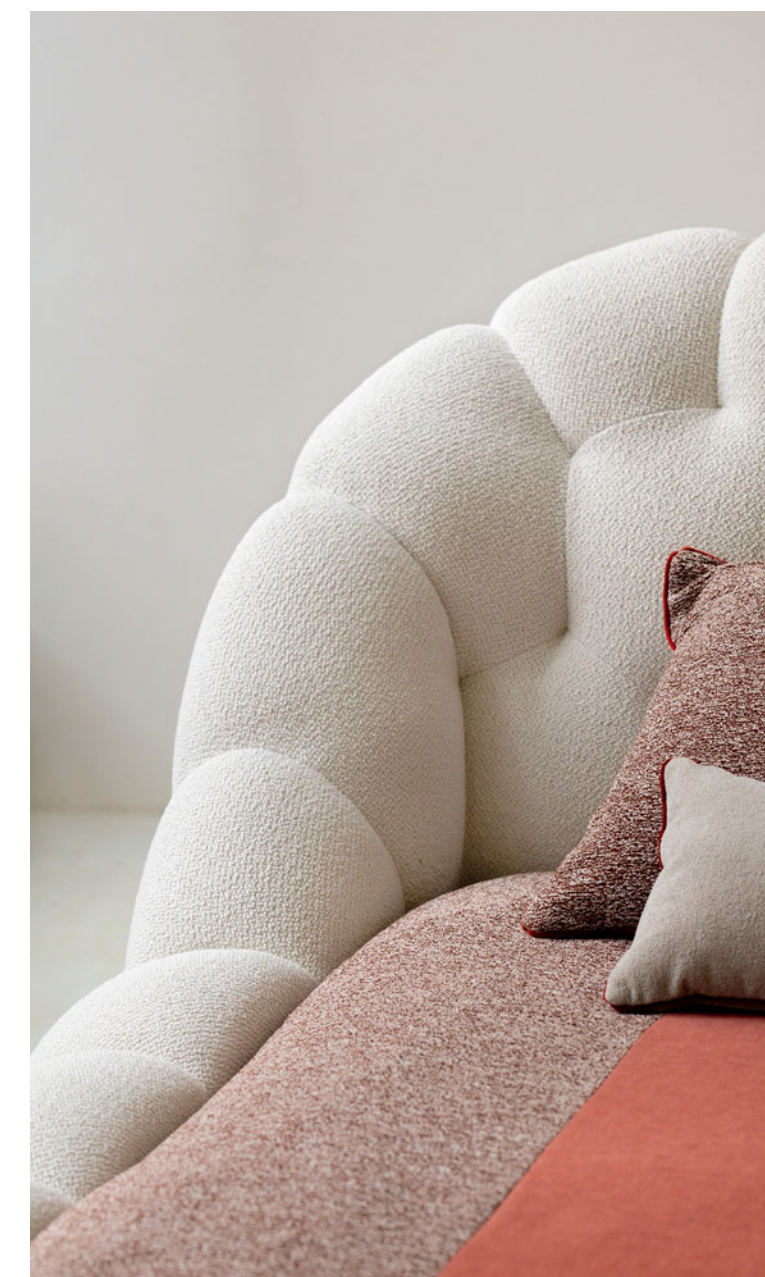
Bubble - designer Sacha Lakic Letto trapuntato