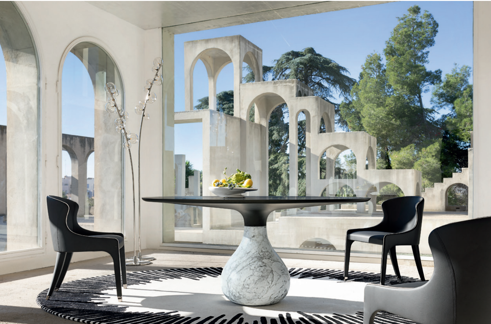
Aqua - design Fabrice Berrux Table de repas ronde, base marbre de Carrare