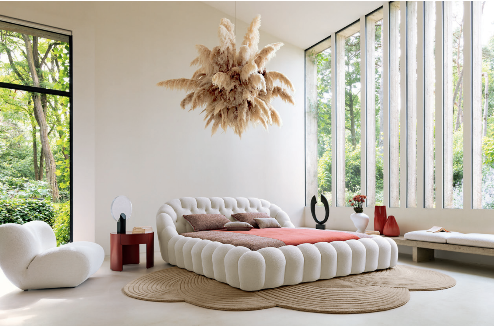
Bubble - design Sacha Lakic Lit, entièrement capitonné