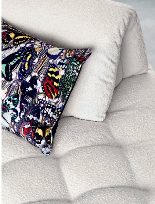
Conversation - design Philippe Bouix Grand canapé 3 places