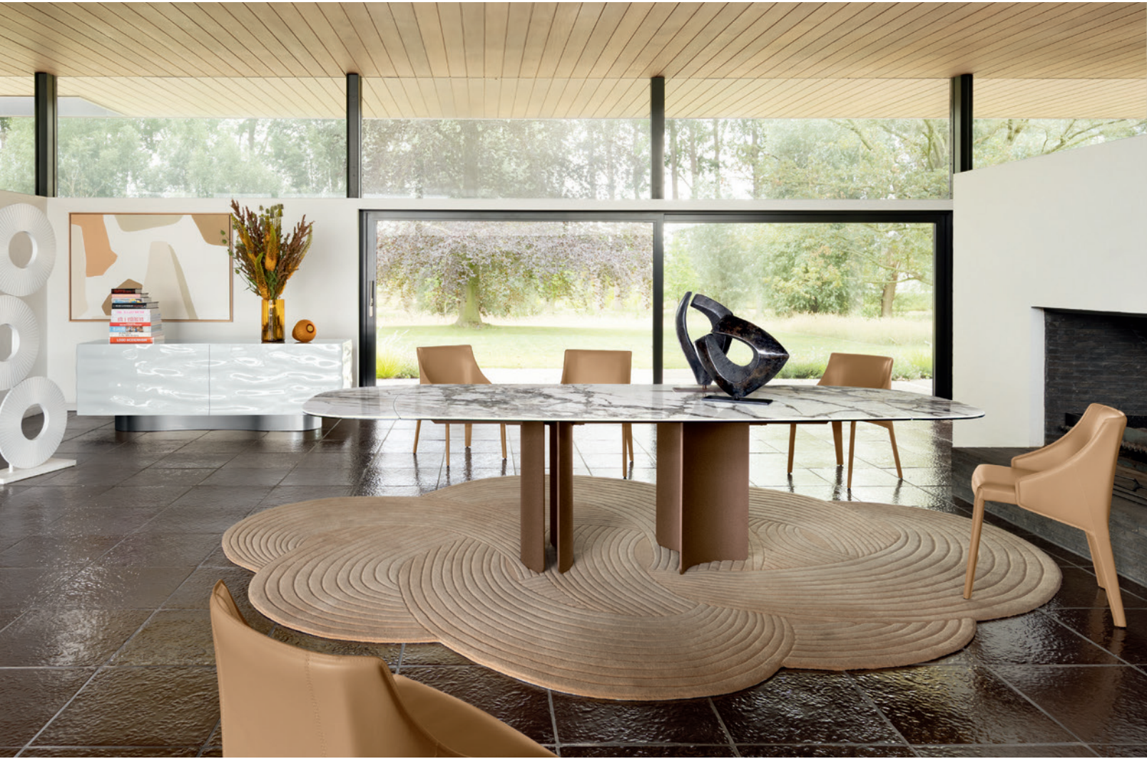
Deltalis - design Maurizio Manzoni Table de repas avec allonges intégrées, plateau verre et céramique