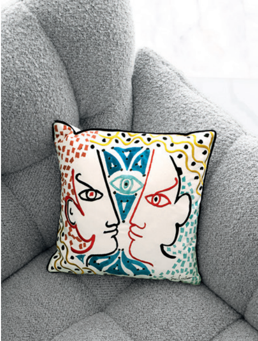
Collection de coussins Jean Cocteau