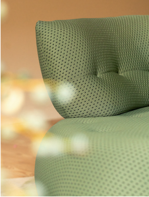
Sense - design Studio Roche Bobois Canapé modulable