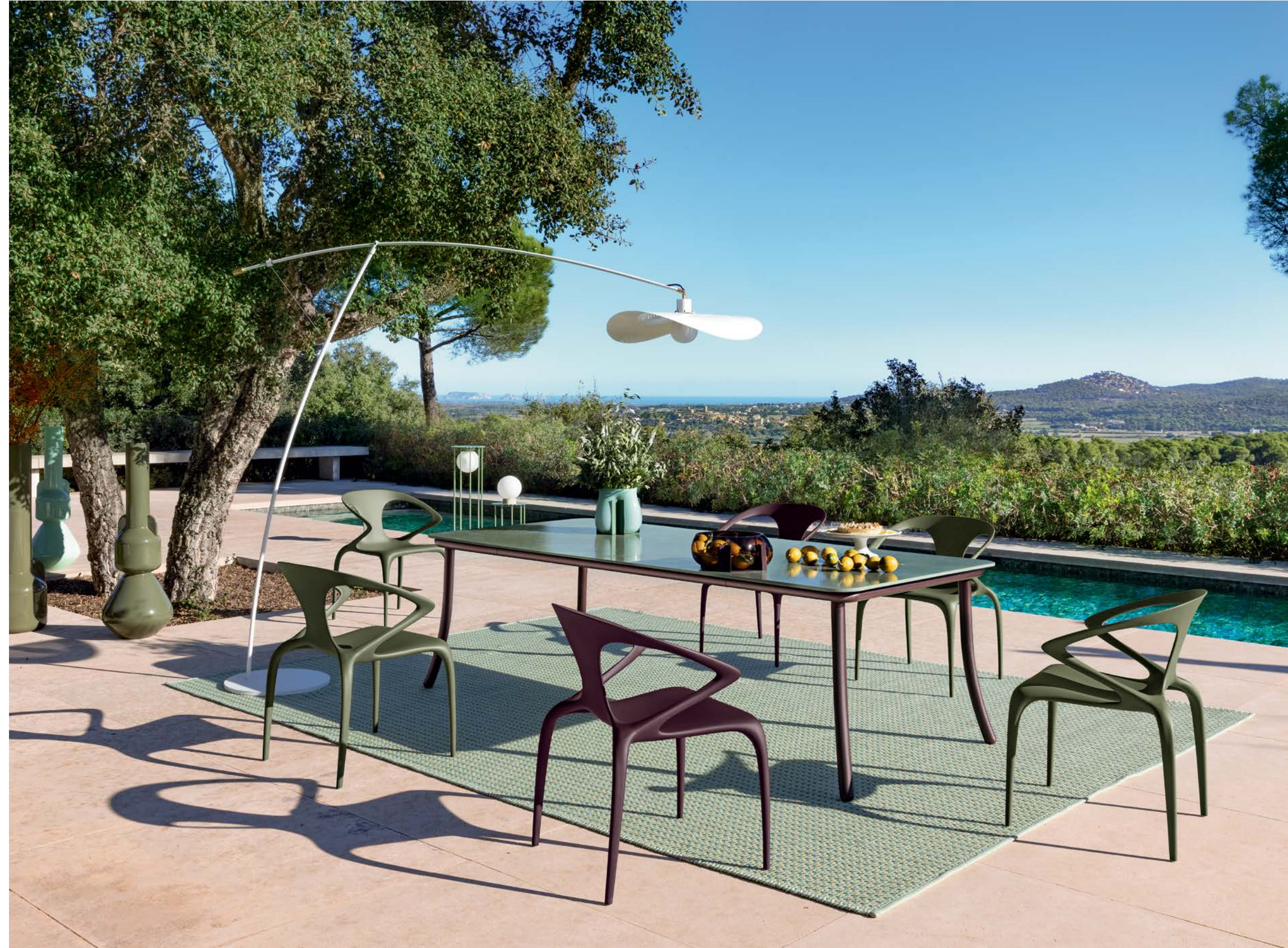
Catalina - design Stephen Burks Table de repas, plateau céramique