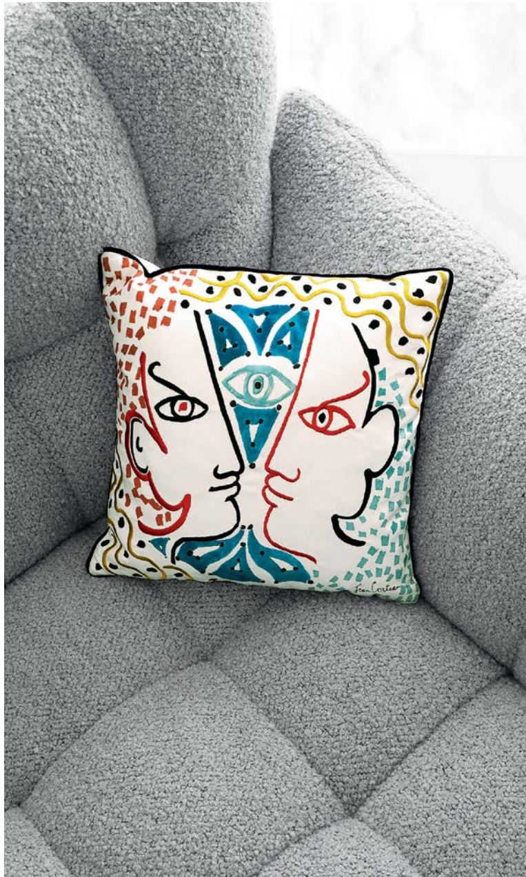
Collection de coussins Jean Cocteau.

Setup - design Sacha Lakic Grand canapé 3 places, entièrement capitonné