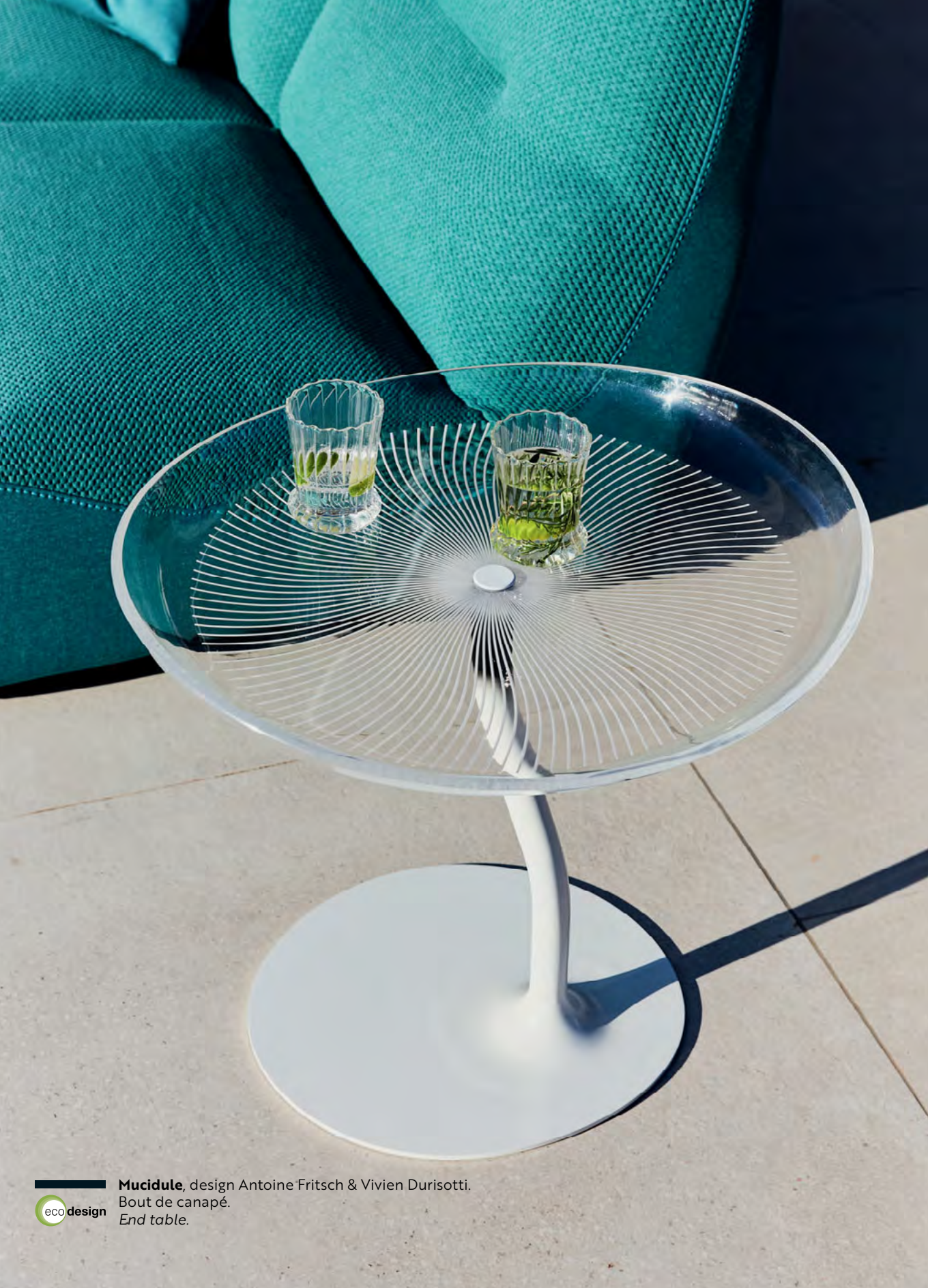
Mucidule , design Antoine Fritsch & Vivien Durisotti. Bout de canapé. End table.