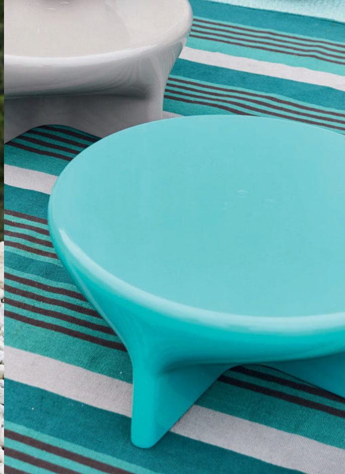
Rocket Outdoor , design Nathanaël Désormeaux & Damien Carette. — Table basse. Cocktail table.