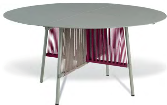
Traveler Table de repas ronde. Round dining table.