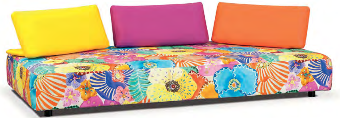
Escapade , design Zeno Nugari. Canapé habillé de tissu à motifs Missoni Home Collection et de tissu uni. Sofa upholstered in patterned Missoni Home Collection and in plain fabric.