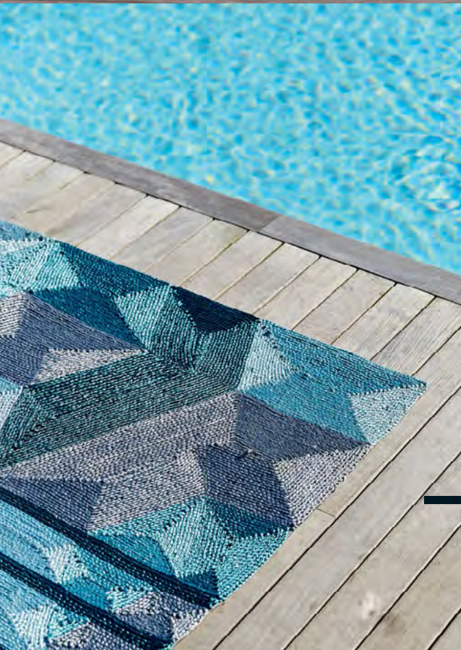
Hexagone , design Éric Gizard. Tapis. Rug.