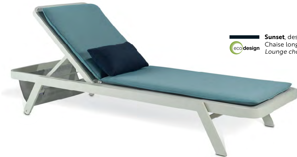
Sunset , design David Rockwell. — Chaise longue. Lounge chair.