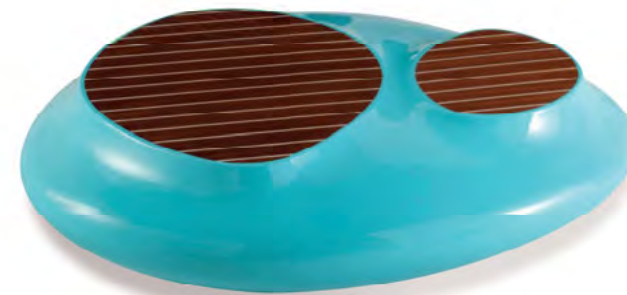
Cute Cut Marine , design Cédric Ragot. Table basse. Cocktail table.