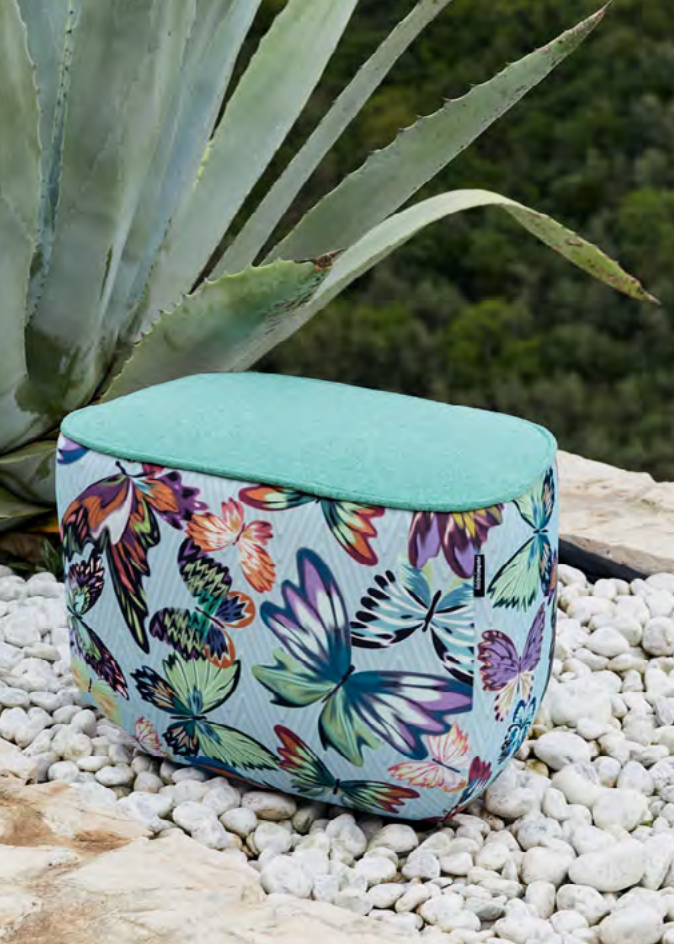
Trilogie , design Sacha Lakic. — Pouf. Ottoman.