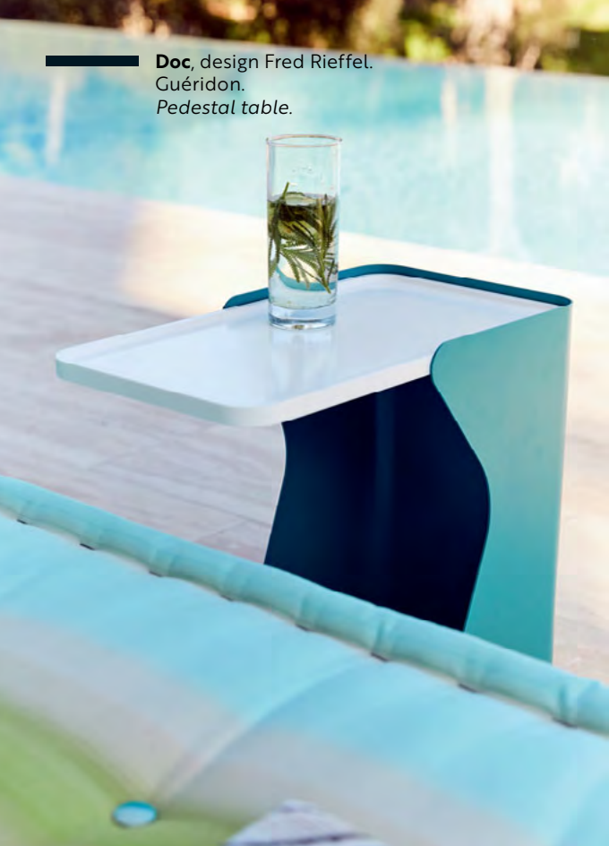
Doc , design Fred Rieffel. Guéridon. Pedestal table.