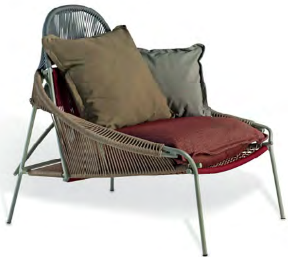
Traveler Fauteuil lounge. Lounge armchair.