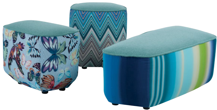
Trilogie , design Sacha Lakic. Collection de poufs habillés de tissu unis et à motifs.