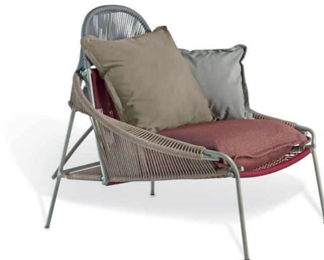
Traveler Corde Fauteuil lounge.