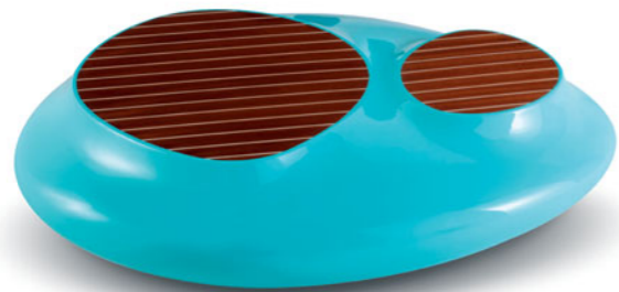
Cute Cut Marine , design Cédric Ragot. Table basse, laque brillante et placage noyer vernis.