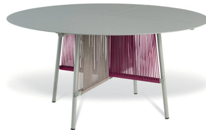
Traveler Corde Table de repas, plateau en métal perforé.