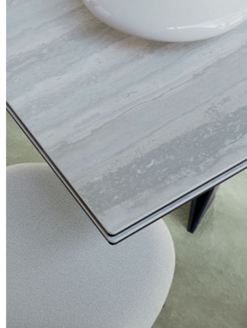
Cigale - design Andrea Casati Mesa de jantar com extensões integradas, tampo vidro e cerâmica 4.190 €* em vez de 4.990 €