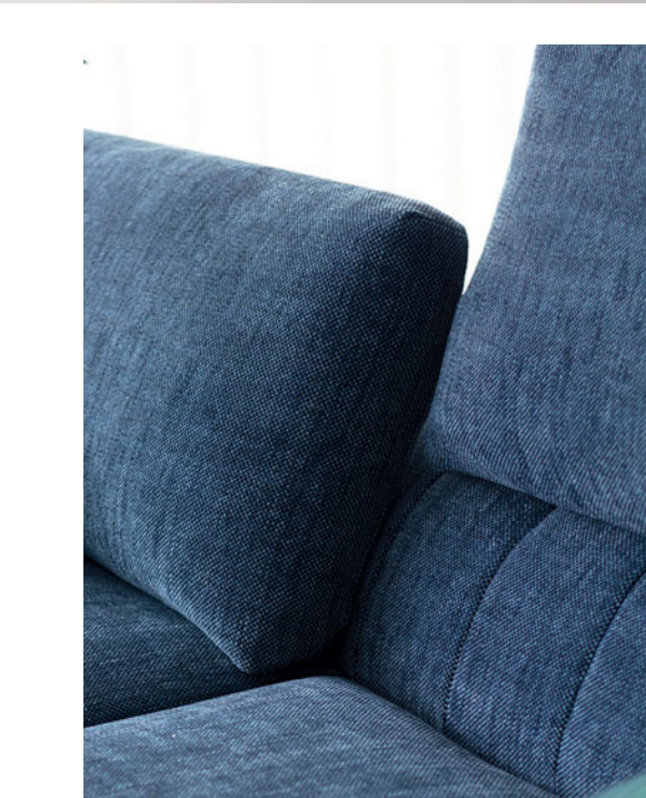
Caractère - design Sacha Lakic Sofá grande 3 lugares, encostos rebatíveis 3.990 €* em vez de 4.830 €