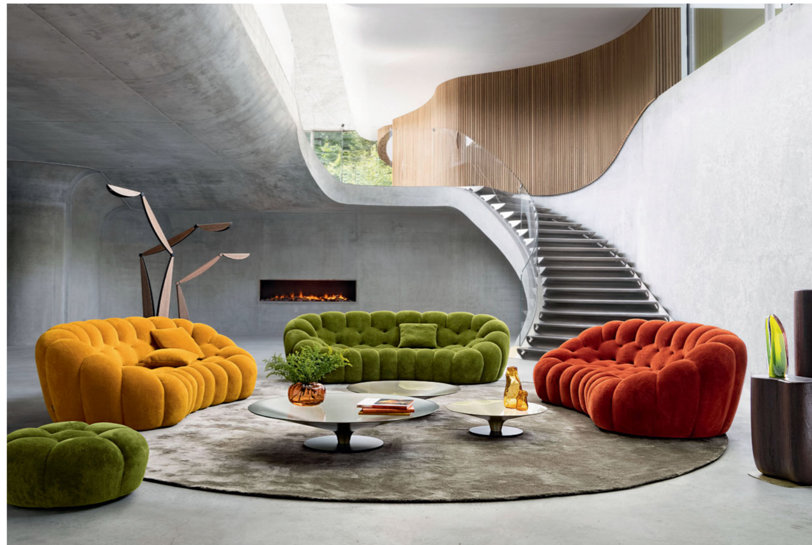
Bubble 2 - design Sacha Lakic Sofá 3-4 lugares arredondado capitonné

A estrutura desta cama é fabricada com madeira certificada FSC® mista. É composta por materiais provenientes de florestas certificadas FSC® geridas de forma responsável e de outras fontes controladas.