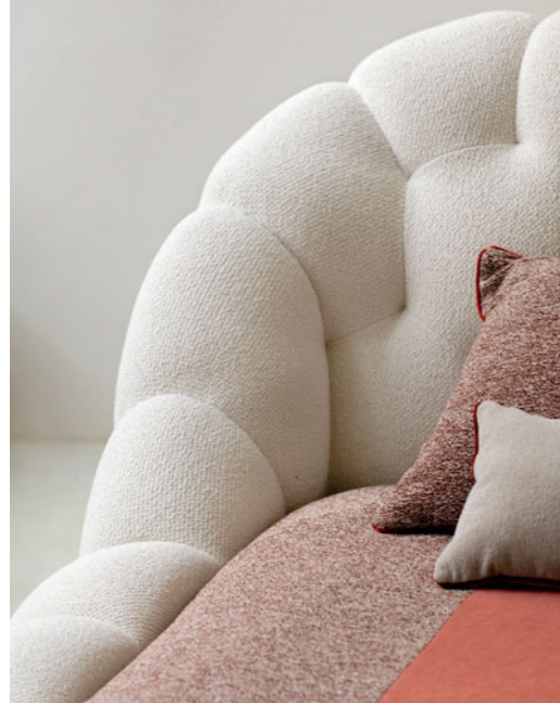
Bubble - design Sacha Lakic Cama capitonné