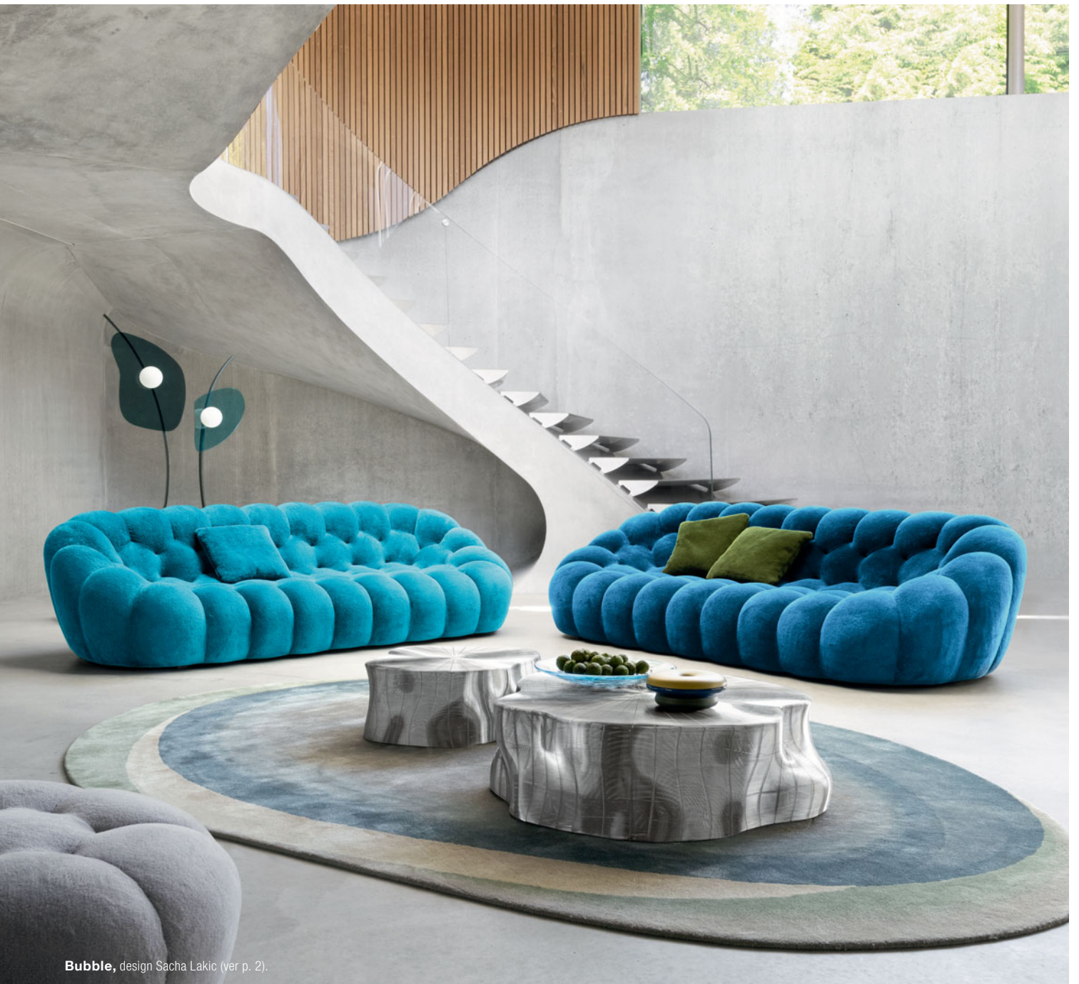
Bubble, design Sacha Ladic (ver p. 2).

PREÇOS MUITO SEDUTORES SOBRE A NOVA COLEÇÃO